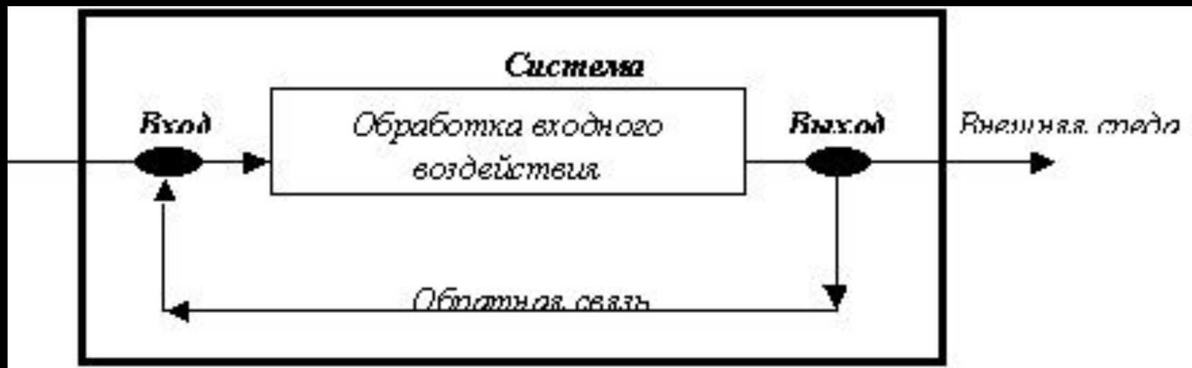
СХЕМА ФУНКЦИОНИРОВАНИЯ СИСТЕМЫ