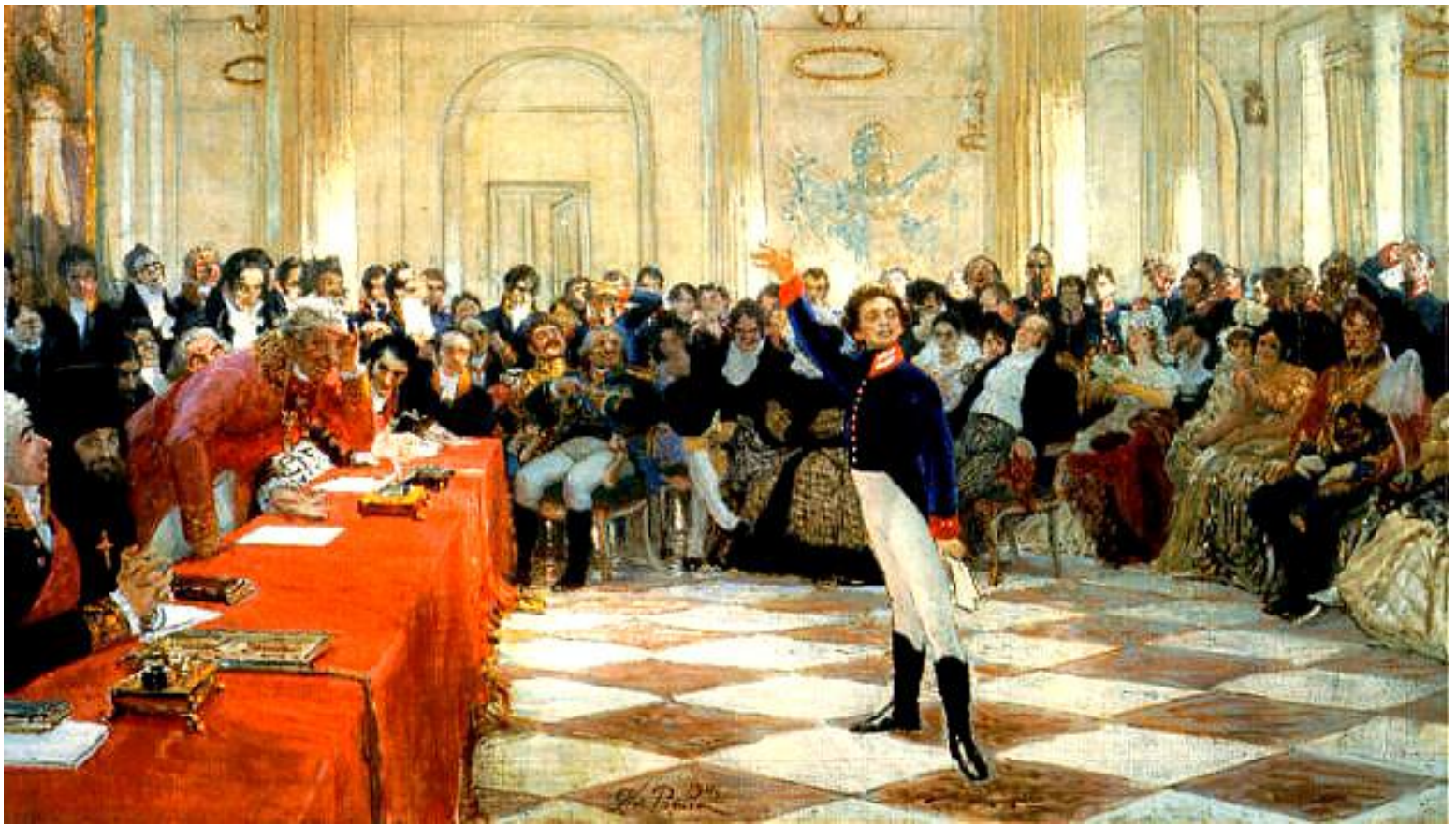
Пушкин на лицейском экзамене. Картина работы И.Е. Репина

8 января 1815 года в Лицее состоялся экзамен. 15-тилетний Александр Пушкин в переполненном зале в присутствии прославленного поэта Гавриила Романовича Державина читал свое стихотворение «Воспоминания о Царском Селе». В этот день Пушкин был признан поэтом.