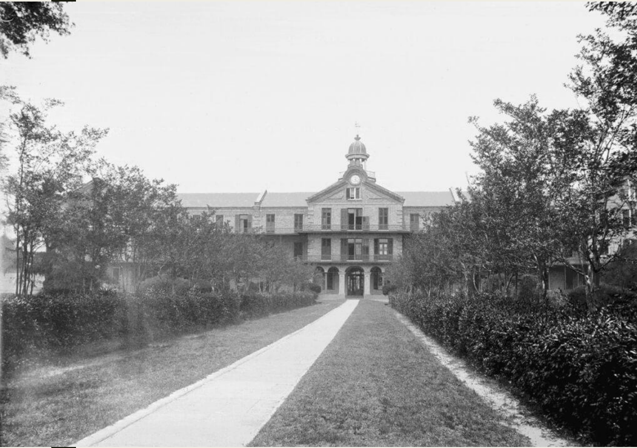
Колледж Спринг Хилл. Алабама, США. Между 1895 и 1910 годом