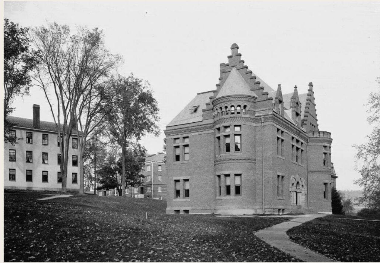
Дартмутский колледж. Нью-Хэмпшир, США. 1900 год