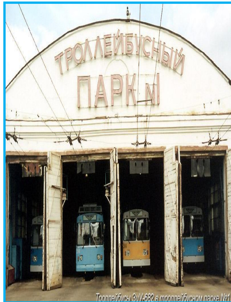
Троллейбусы ЗиУ-682 в троллейбусном парке №1