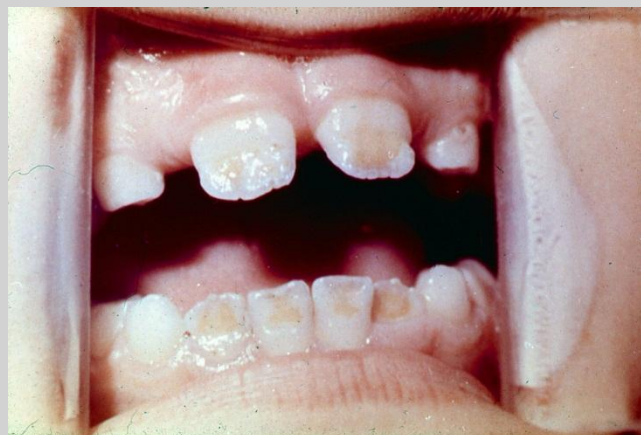
СИСТЕМНАЯ ГИПОПАЗИЯ, ОБНАЖЕНИЕ ДЕНТИНА, 7 ЛЕТ