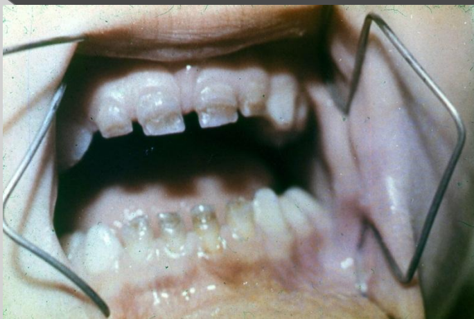
СИСТЕМНАЯ ГИПОПАЗИЯ МОЛОЧНЫХ ЗУБОВ, ПАТОЛОГИЯ АНТЕНАТАЛЬНОГО ПЕРИОДА, 4 ГОДА