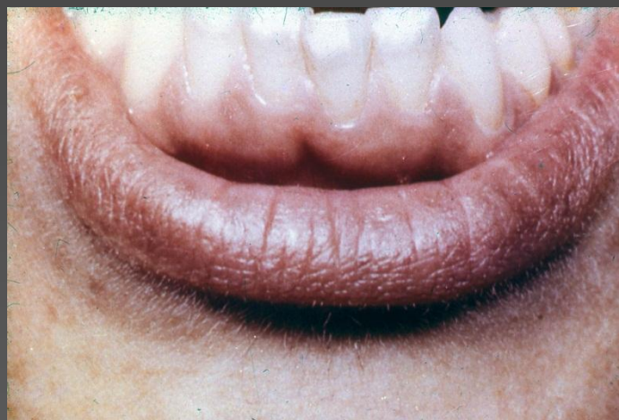
ПЯТНИСТАЯ ФОРМА СИСТЕМНОЙ ГИПОПАЗИИ, 9 ЛЕТ