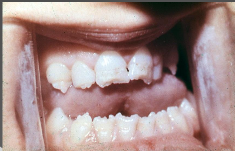
СИСТЕМНАЯ ГИПОПЛАЗИЯ, ДЕФЕКТЫ ЭМАЛИ ПО РЕЖУЩЕМУ КРАЮ И ВДАЛИ ОТ НЕГО, 14 ЛЕТ