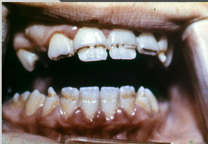
СИСТЕМНАЯ ГИПОПЛАЗИЯ, БОРОЗДЧАТАЯ ФОРМА, 11 ЛЕТ