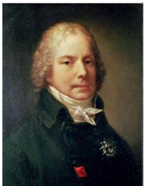
Charles Maurice de Talleyrand-Périgord

La vision moderne du château et ses environs - le mérite de ministre des Affaires étrangères sous Napoléon Talleyrand