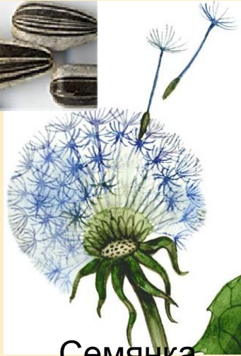
Семянка (одуванчик, подсолнечник)