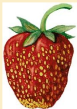
Многoореше к (клубника)