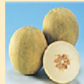
Тыквин а (тыква)