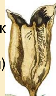
Многолистовка а (дельфиниум)