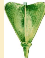
Стручок (пастушья сумка)