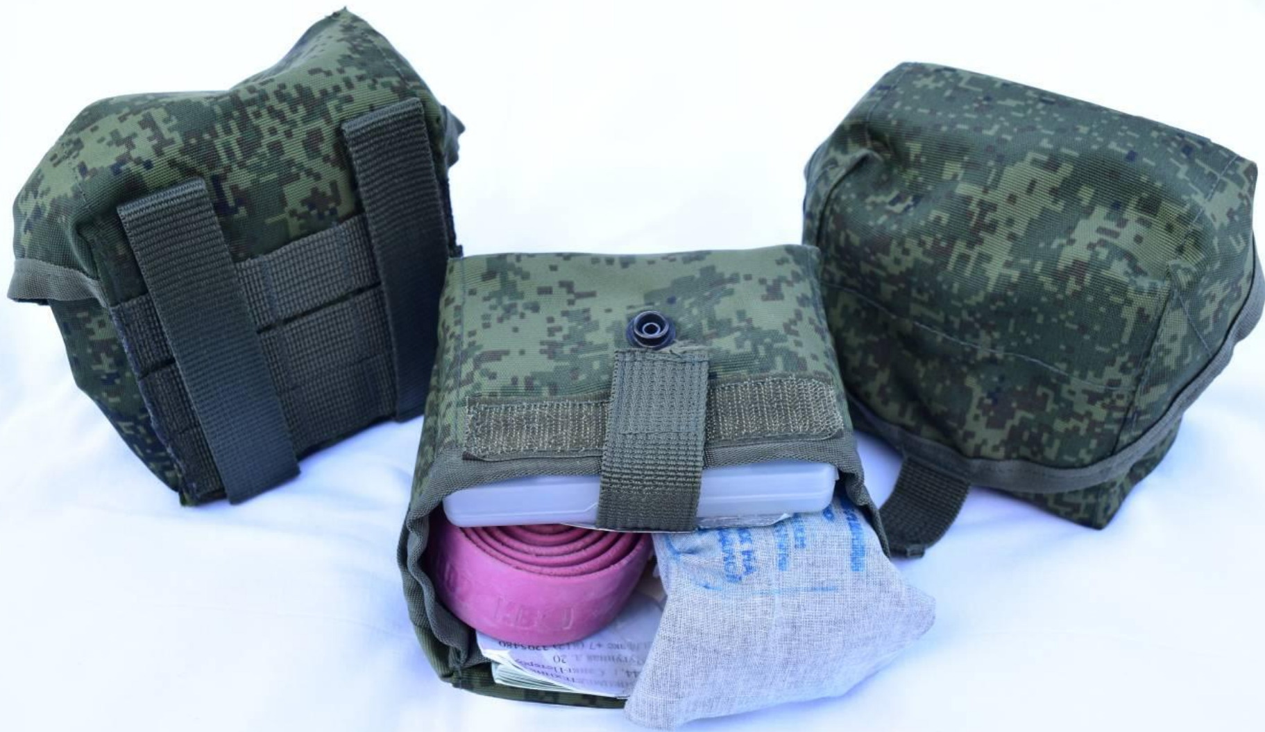
Аптечка первой помощи индивидуальная (АПШИ)