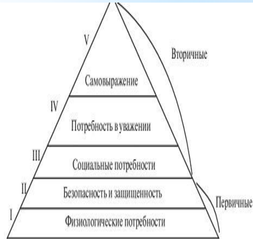
Рис. 2.2. Пирамида потребностей А. Маслоу