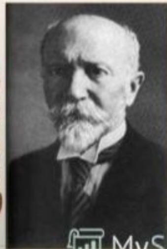
философ Николай Онуфриевич Лосский (1870-1965)