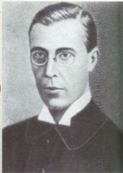
философ- социолог Питирим Александрович Сорокин (1889-1968)