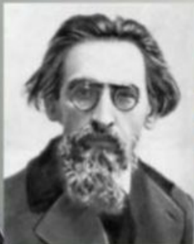
философ Лев Платонович Карсавин (1882-1952)