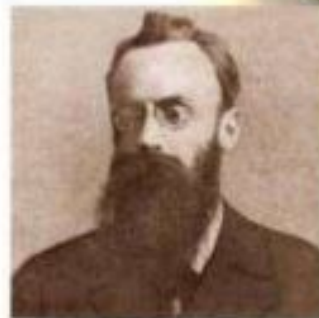
историк Александр Александрович Кизеветтер (1866-1933)