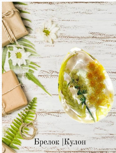
Брелок | Кулон