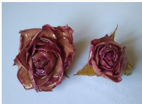
Заливка с сохранением объема и формы изделия