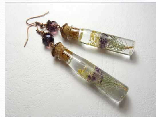
Заливка в стеклянные емкости