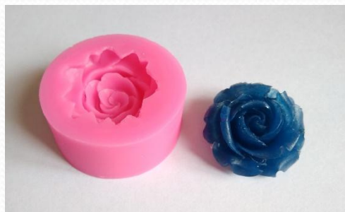
Заливка в объемные формы