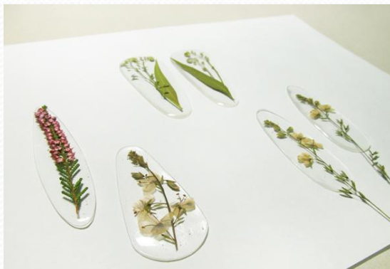
Заливка на силиконовой коврике