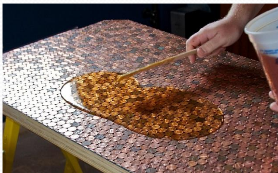
Заливка на поверхность материала