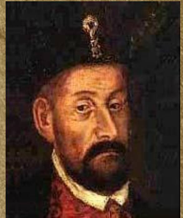
Польский король Стефан Баторий. 1576 год.