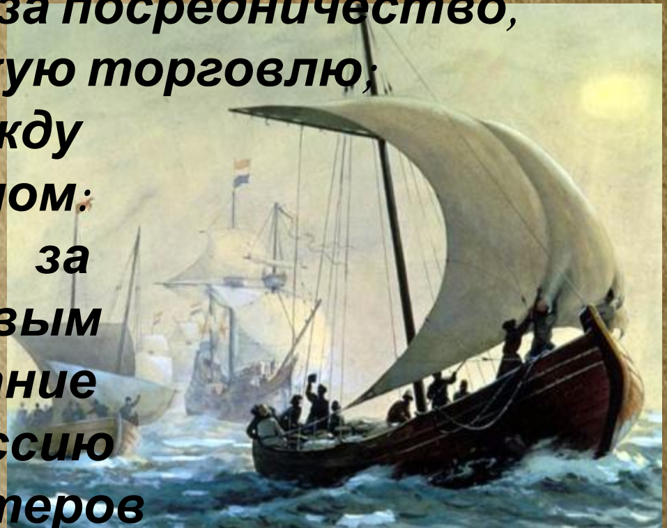
Русское поморское судно. XVI в.