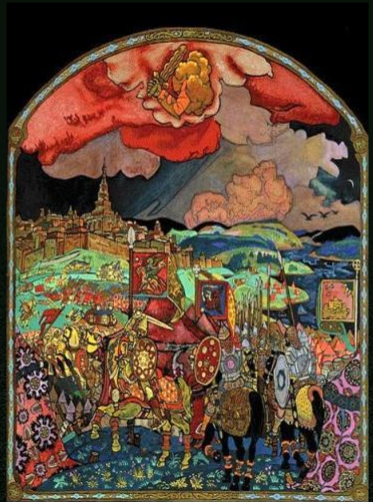
Покорение Казани. Н.К.Рерих 1916 год