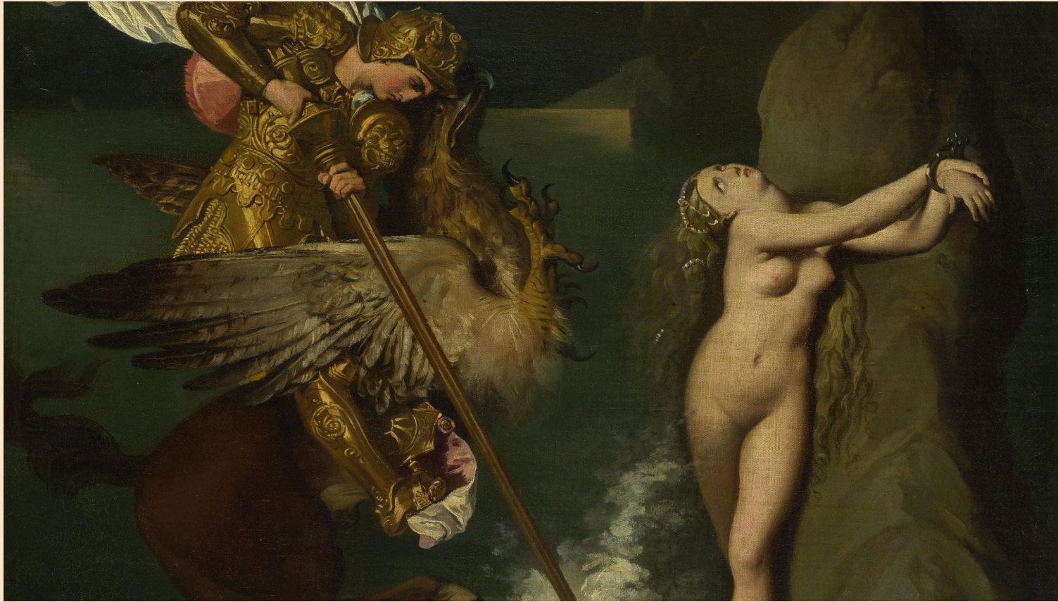
“Руджиеро, освобождающий Анжелику”, Жан Огюст Доминик Энгр. (1819 г.)