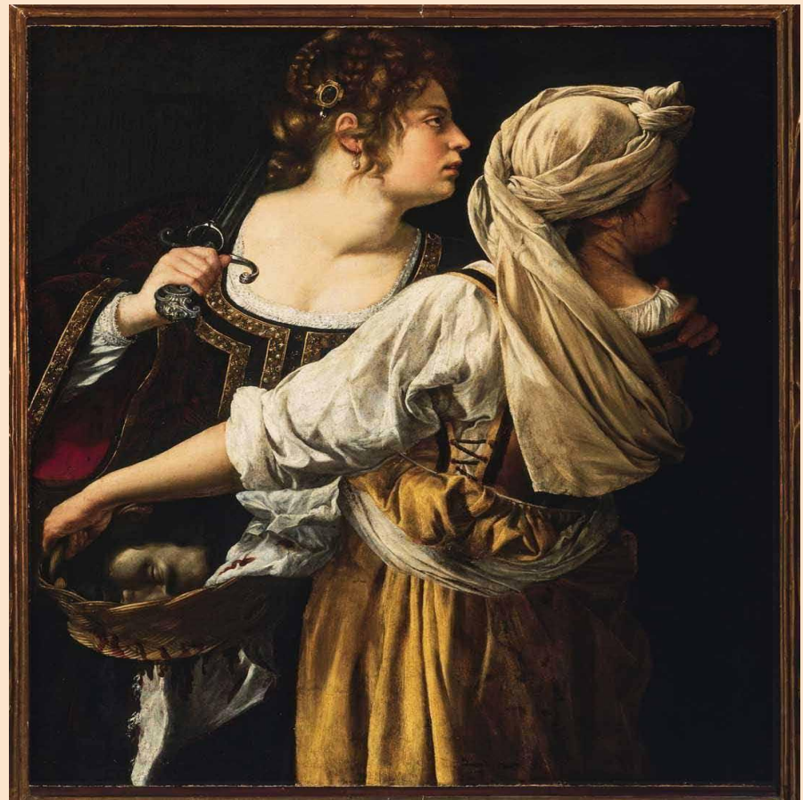
“Юдифь и ее служанка”, Джанилески (ок. 1613-1614 г.)