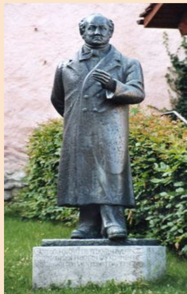
Альберт Бициус, статуя в Муртене, Франция

Для лечения зоба у Готтельфа использовали раствор Люголя , что привело к йод-индуцированному тиреотоксикозу и смерти от сердечной недостаточности.