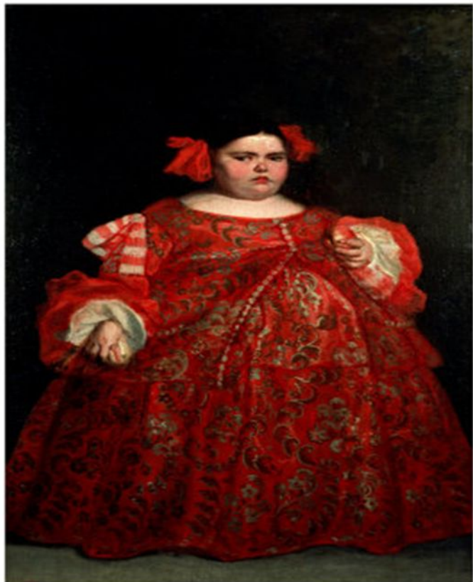
Портрет Евгении Мартинес “la monstra”, Хуан Карреньо де Миранда (1680 г.)