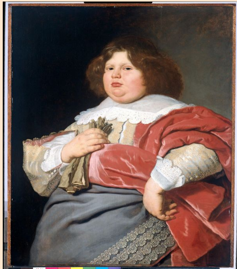
Портрет Жерарда Андреаса Беккера, работа нидерландского живописца Бартоломеуса ван дер Хелста