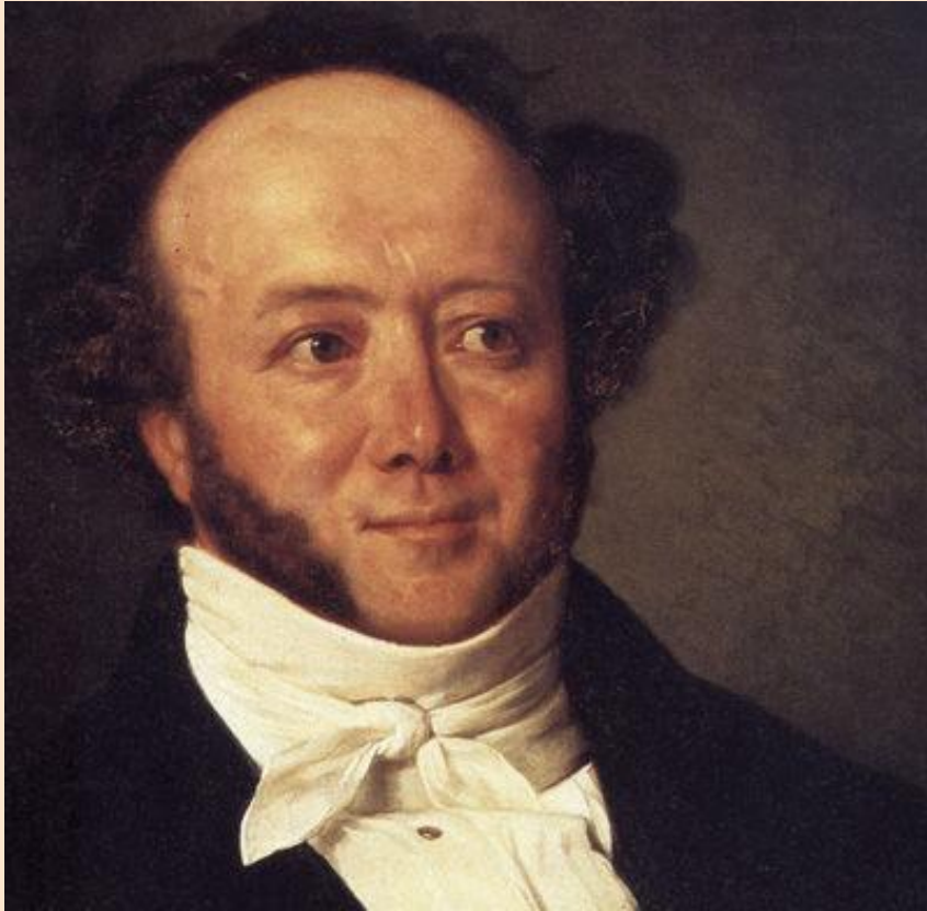
Альберт Бициус, 1844 г.

Альберт Бициус (Джереми Готтельф)- выдающийся швейцарский народный писатель.