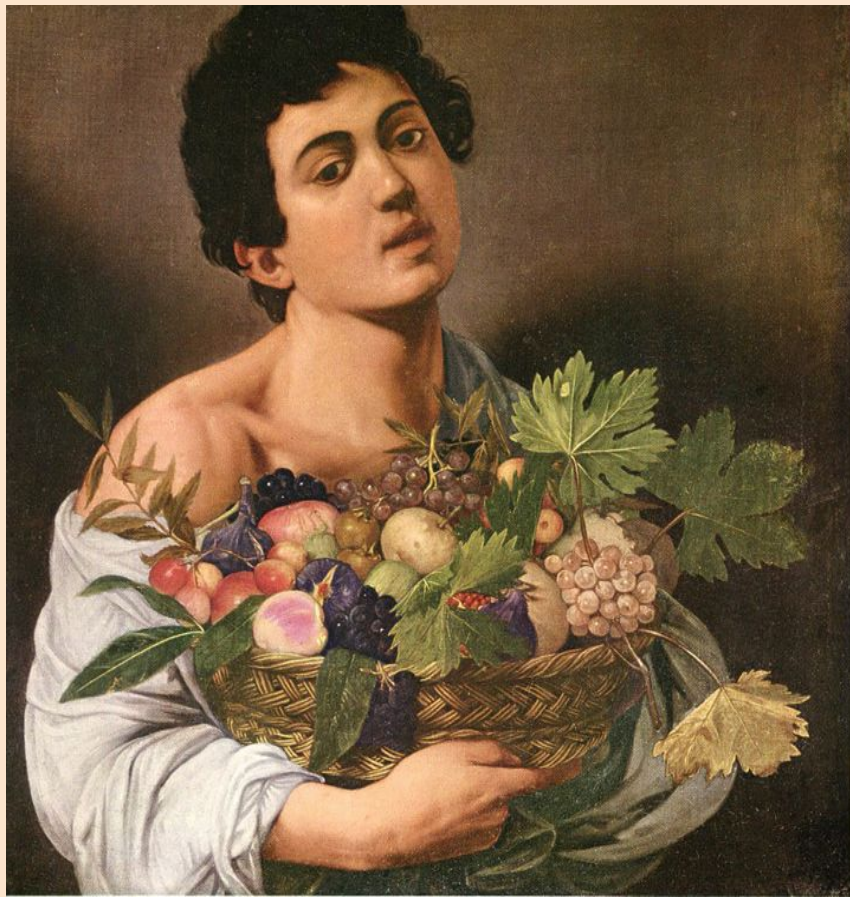
«Юноша с корзиной фруктов», Караваджо (ок. 1593-1594 г.)