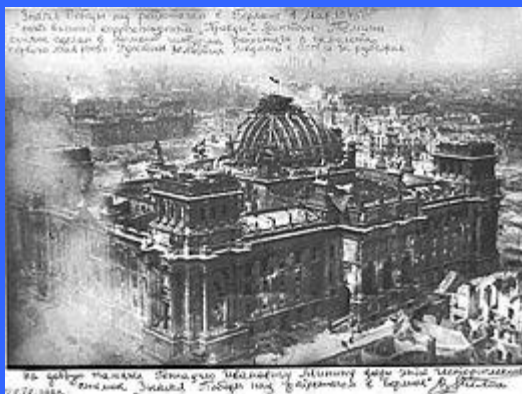
Войска Советского Союза вступают в Берлин, 1945 г.