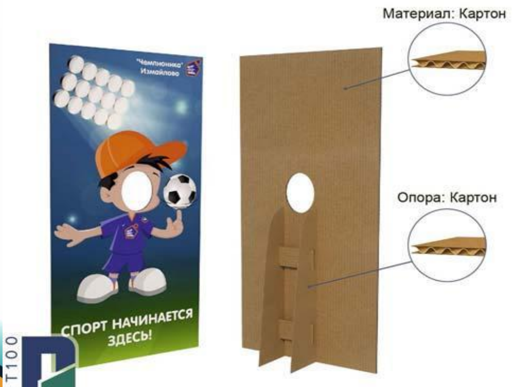
Тантамареска Эконом (помещение)

Тантамарески используются при проведении общественных мероприятий, торжеств, концертов, рекламных акций, на праздниках.