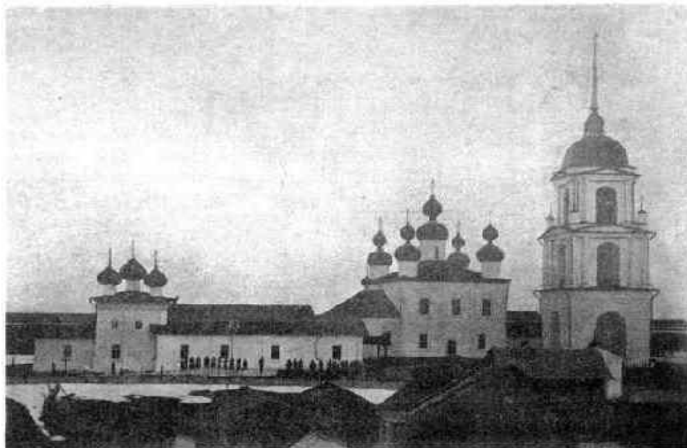
Рис. 10. Церкви Тихманьгского прих. (слева Никольская, справа Вознесенская).

В 1744 г. была перестроена в камне Никольская церковь, а в 1800 г. - Вознесенская церковь (переосвящена). При церквях была каменная высокая и красивая колокольня. Из публикации в «Олонецких епархиальных ведомостях»: «По рассказам стариков, они целыми десятками и сотнями приходили помогать при постройке храмов и исполняли без платы разную работу. И создали два обширных, в сравнении с другими даже громадных, каменных храма с такою же очень высокою колокольнею.