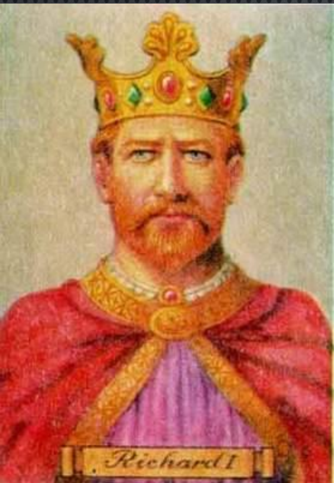
Ричард I Львиное Сердце.