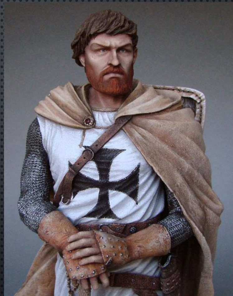
Фридрих I Барбаросса