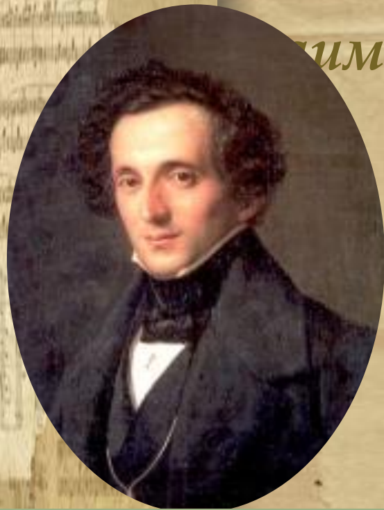
ФЕЛИКС МЕНДЕЛЬСОН (1809-1847)