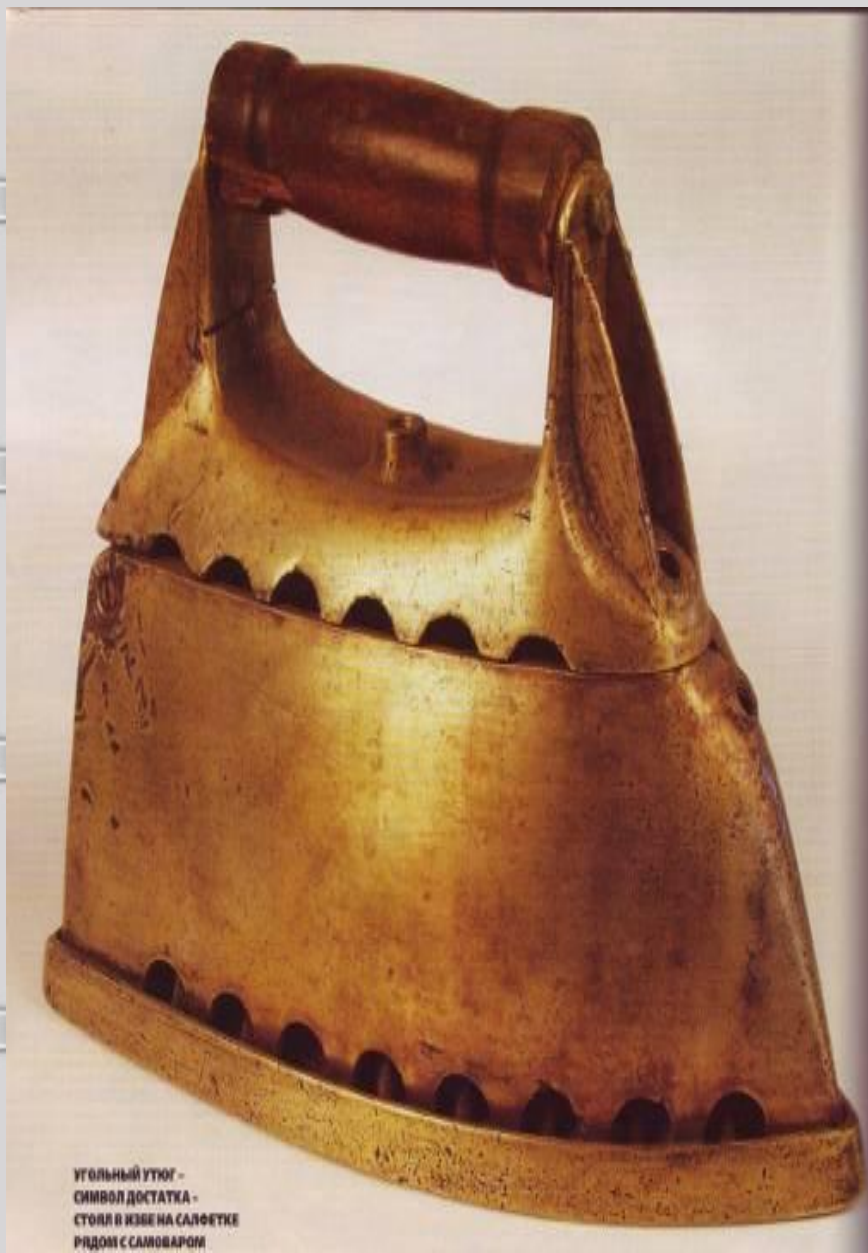
УГОЛЬНЫЙ УТЮГ - СИМВОЛ ДОСТАТКА - СТОЛ И КИЗЕ НА САЛФЕТКЕ РЯДОМ С САЛОВАРОМ

-Утюг- тяжелый нагревающийся металлический прибор для глажения одежды и тканей