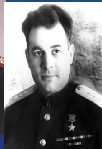
Черняховский ф. И.В.