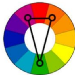
Комплементарная триадная схема