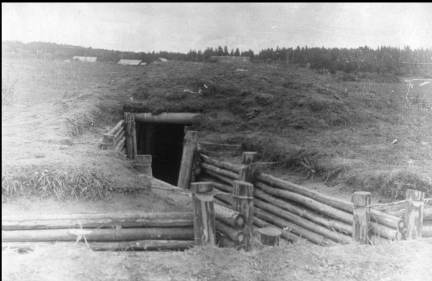
Блиндаж на висоте 251 у разъезда Дубосеково