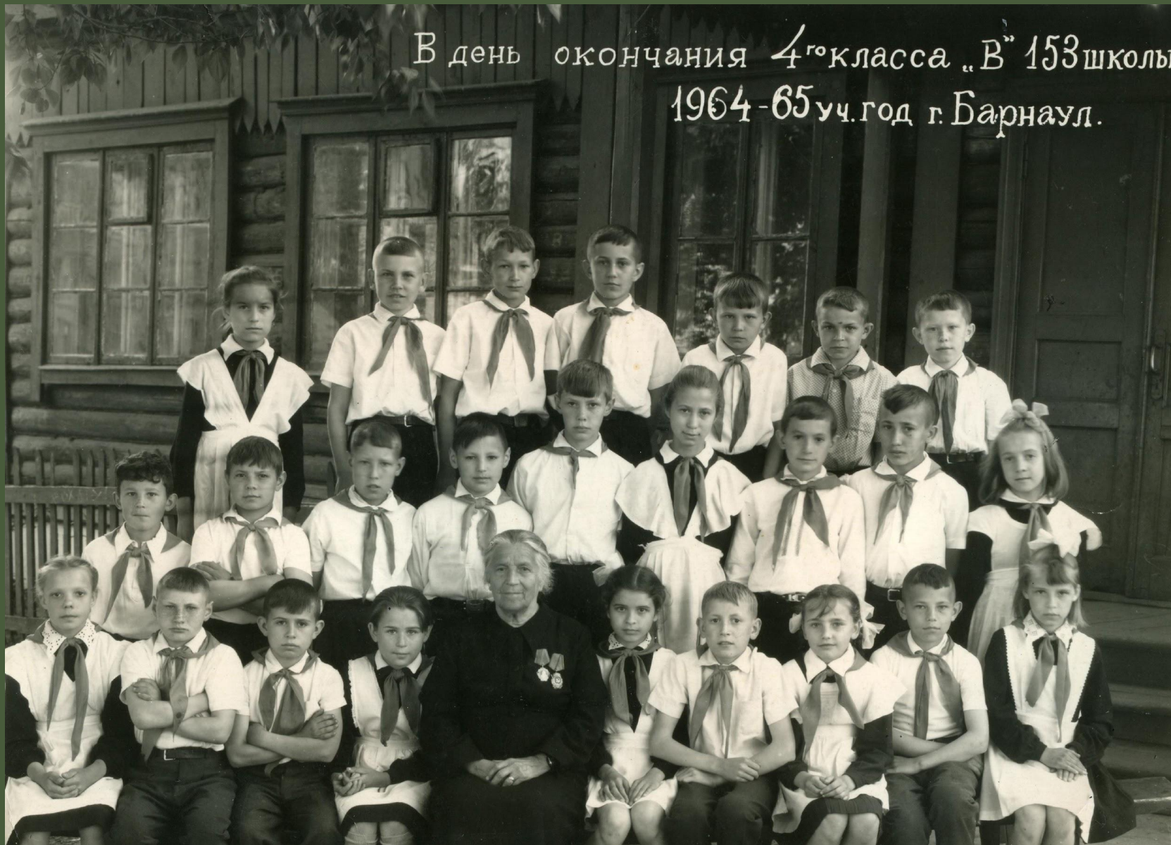
4 В класс. 1965 год

В день окончания 4 го класса „В” 153 школы 1964-65 уч. год г. Барнаул.