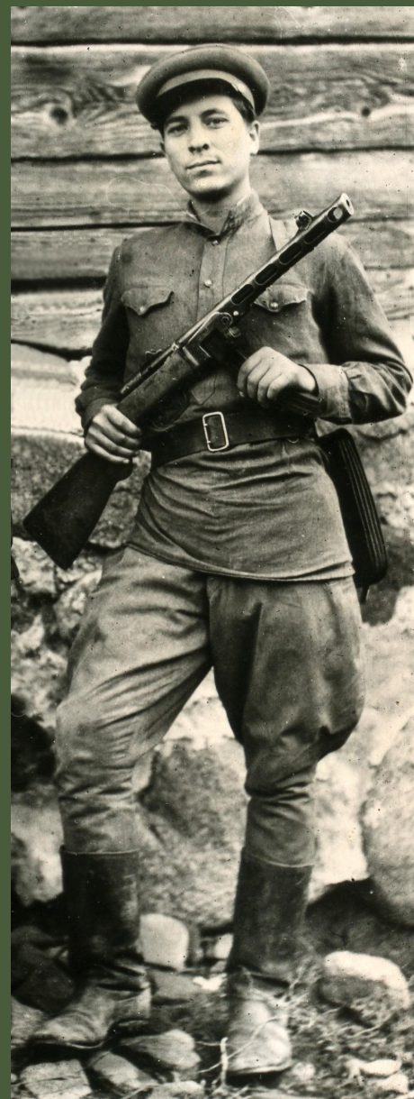
Глеб Воров. 1947 год