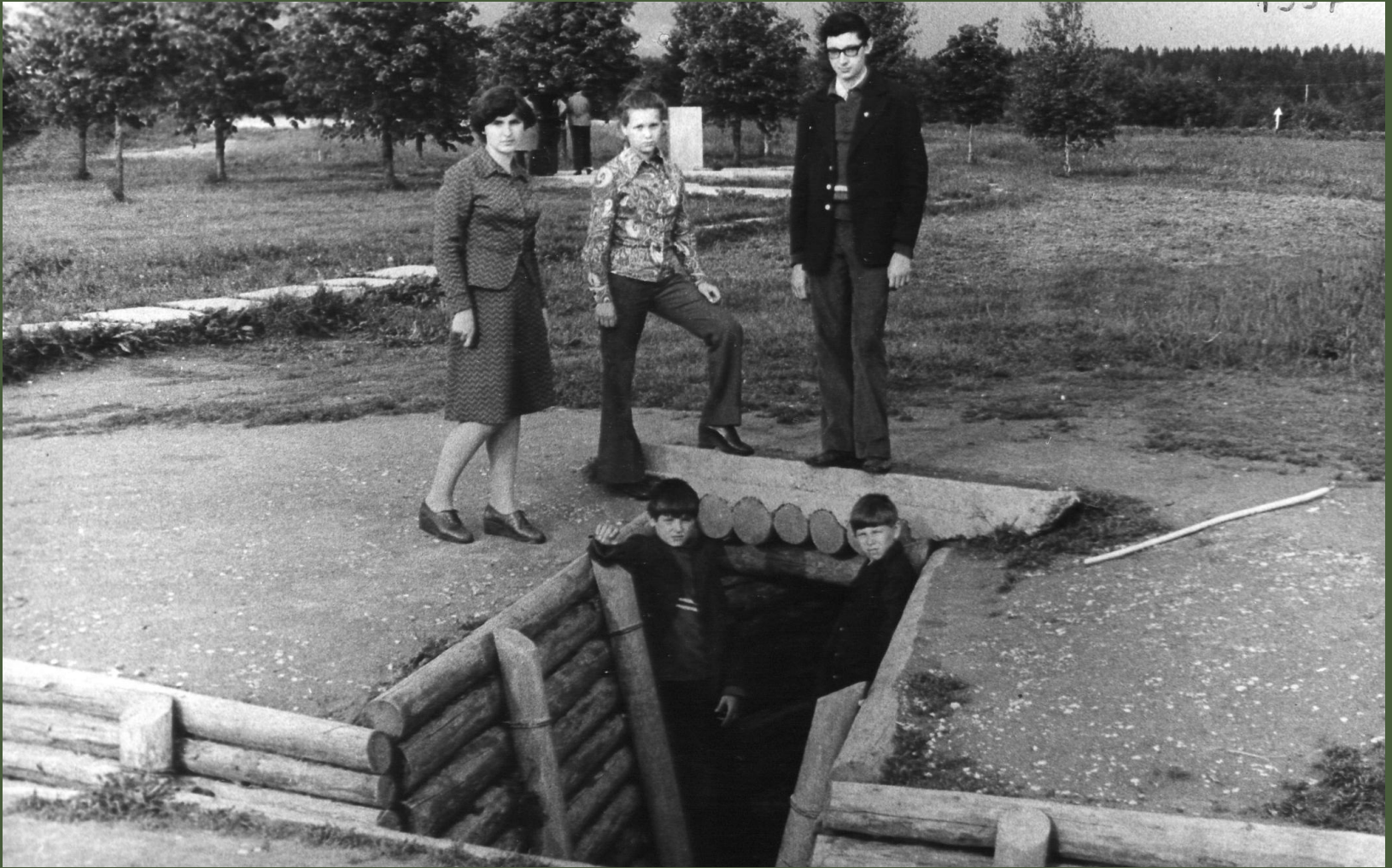
У одного из окопов на месте легендарного боя. Начало 70-х гг.