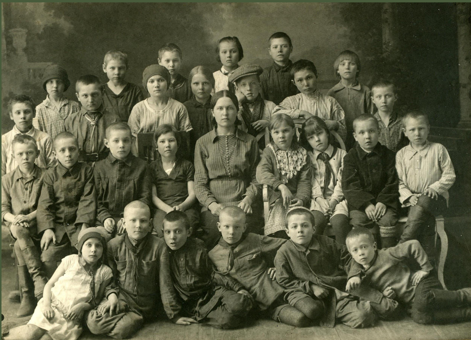
4-й класс 104-й школы. 1934-1935 год.