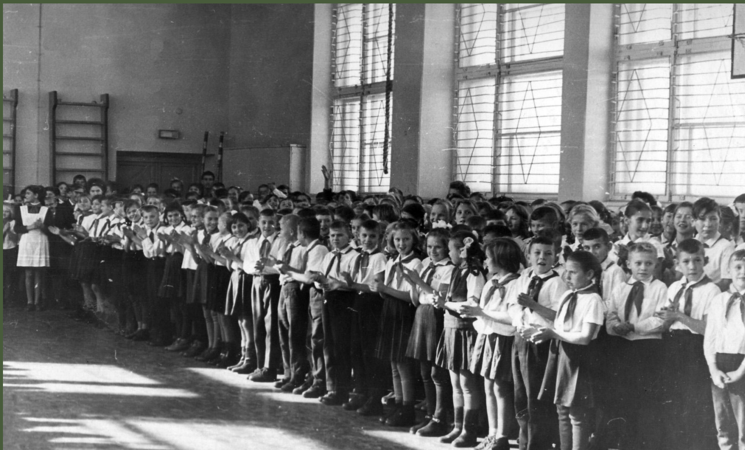
Торжественная линейка в спортзале. 18 ноября 1966.