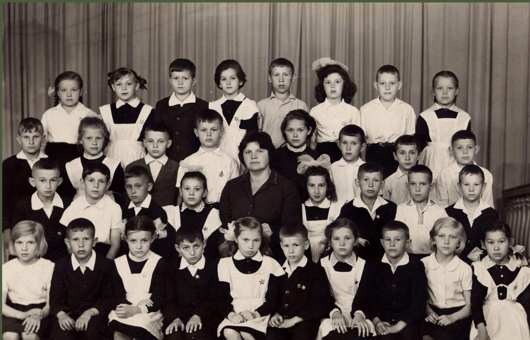
2 А класс. 1966 год