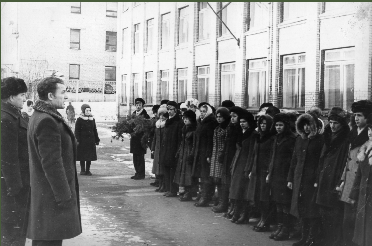
Торжественная линейка на митинге в честь установки памятника И. В. Панфилову. 18 ноября 1976 года