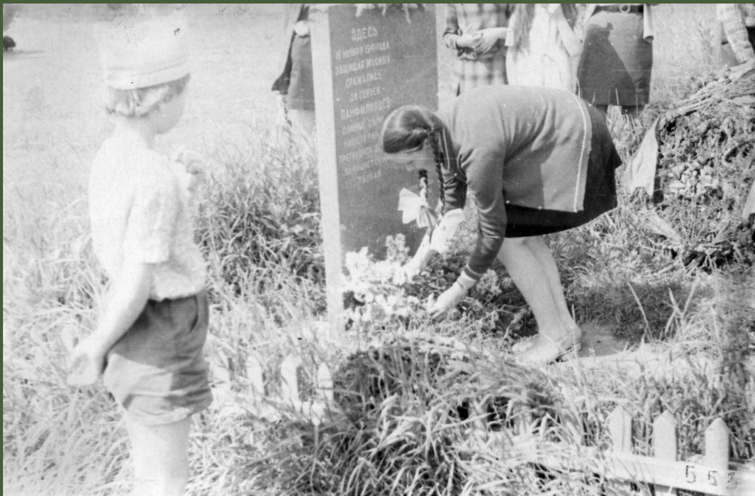
Возложение цветов к памятнику на месте боя.