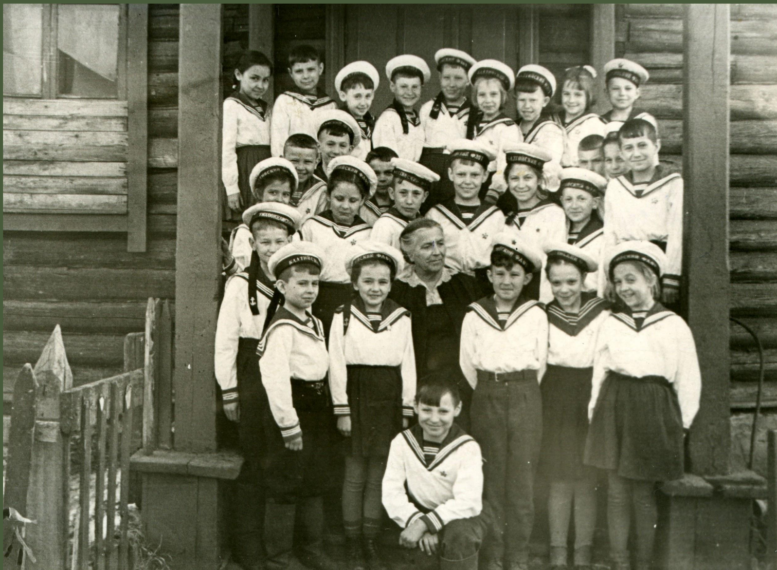
3 В класс у центрального входа в школу. 1964 год