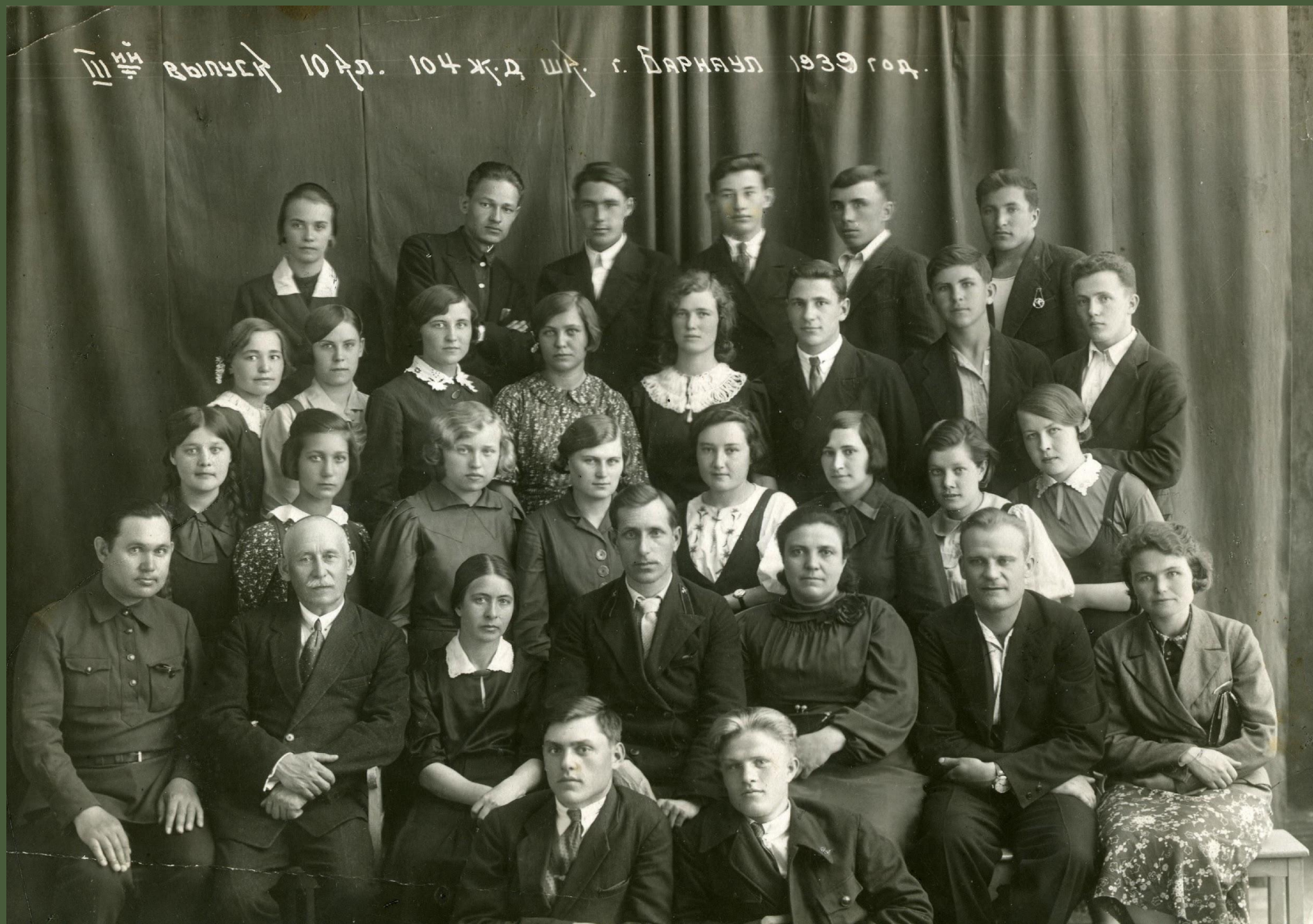
10-й класс 104-й школы. 1939 год