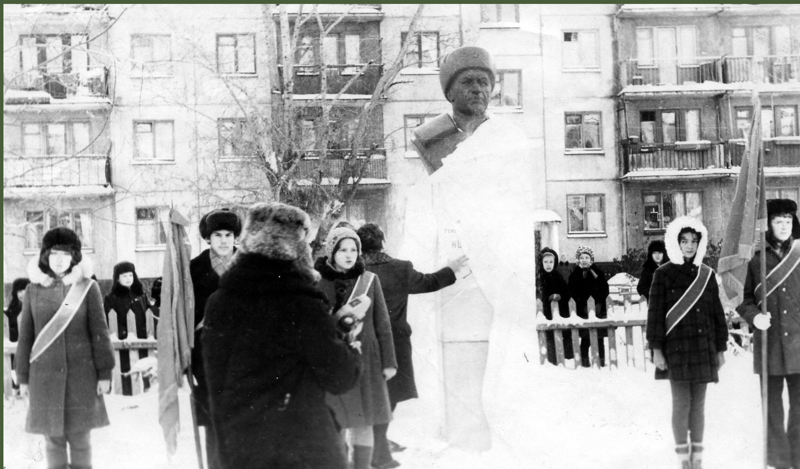
Открытие памятника генералу И. В. Панфилову. 18 ноября 1976 год.