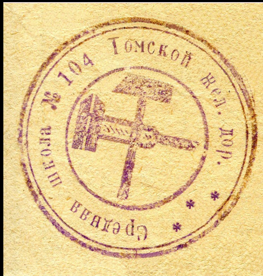
Печать 104-й школы. 1941 год