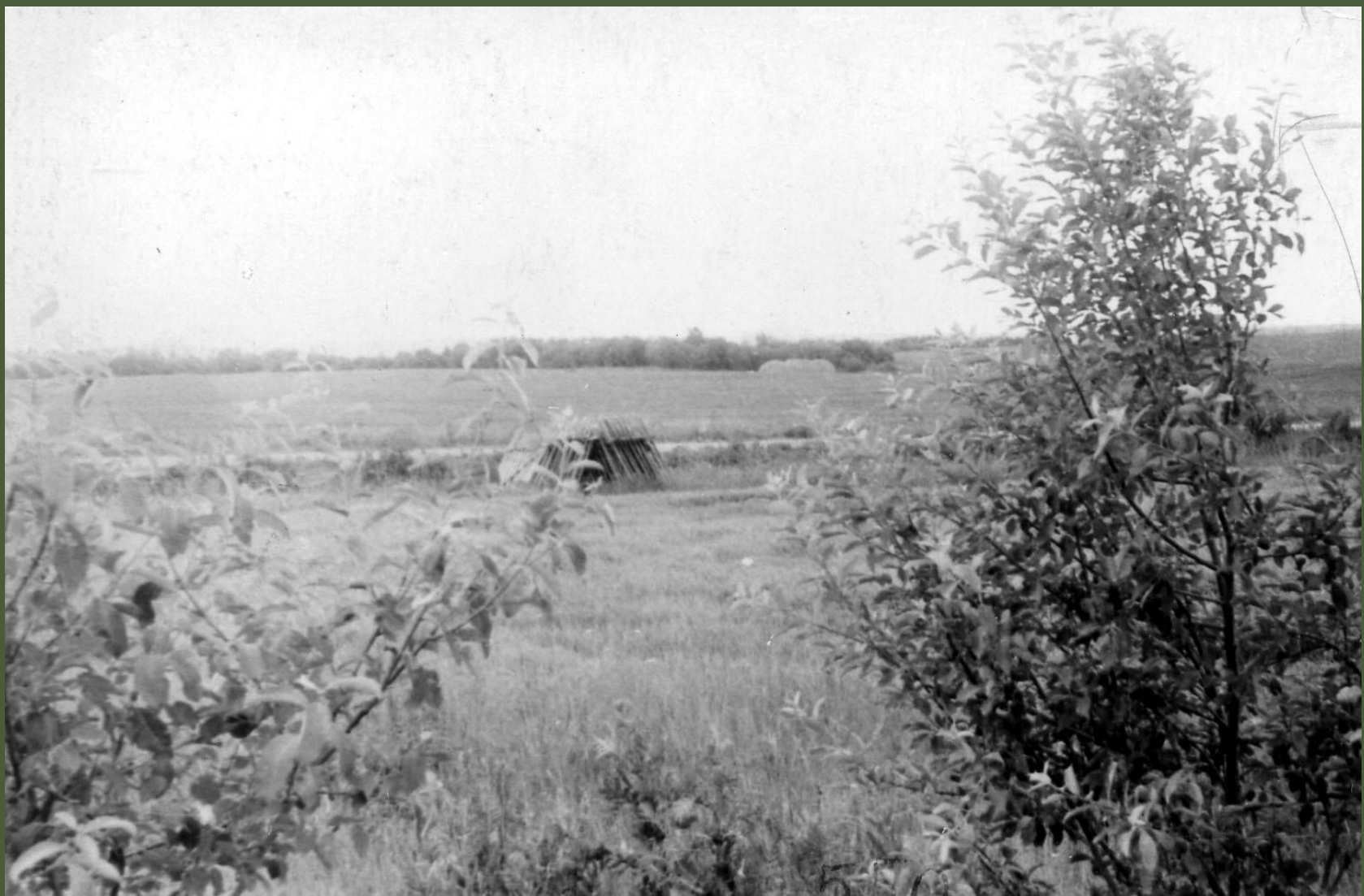
Место боя у разъезда Дубосеково