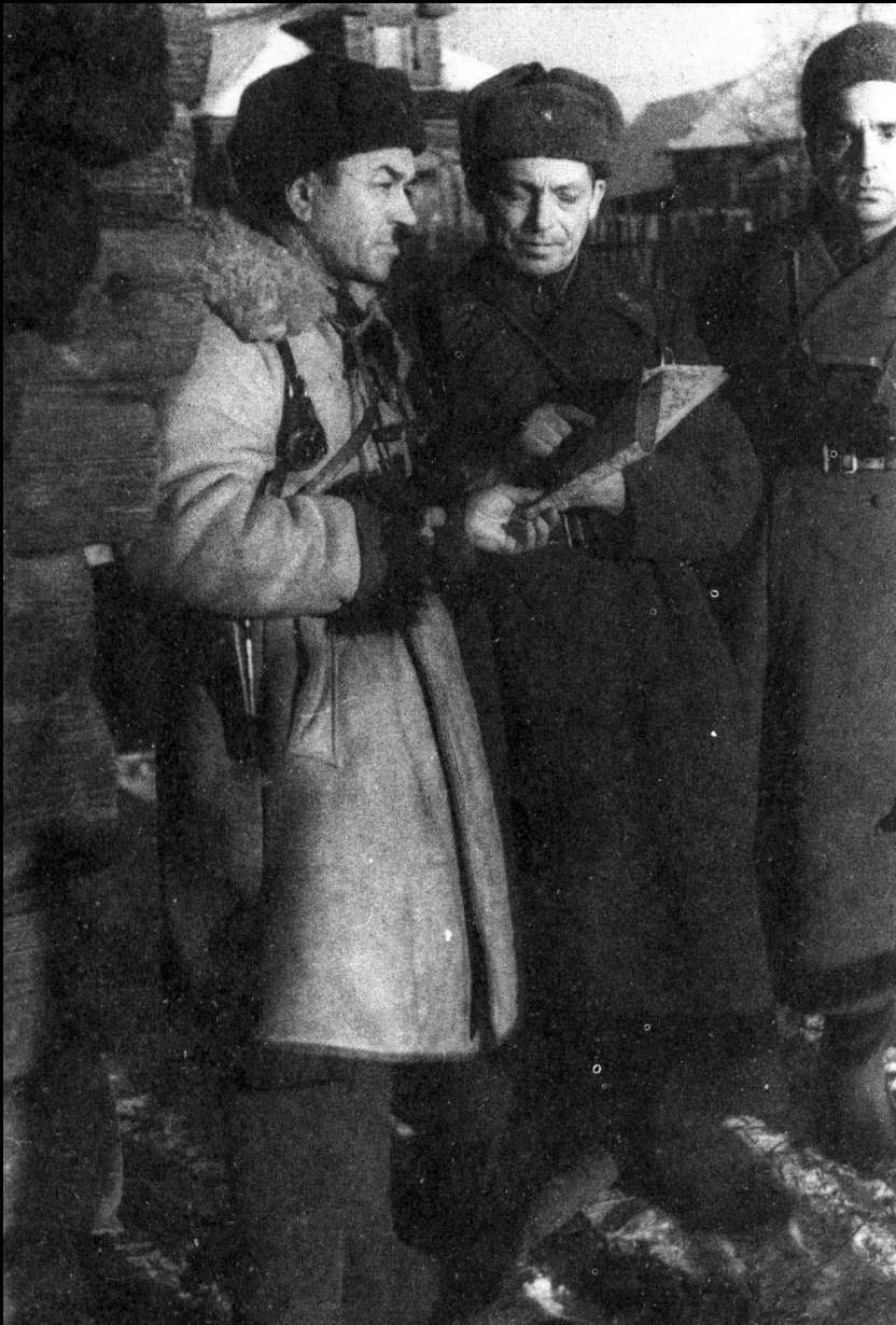
Генерал-майор И. В. Панфилов (слева) с чинами штаба дивизии. 18 ноября 1941 года