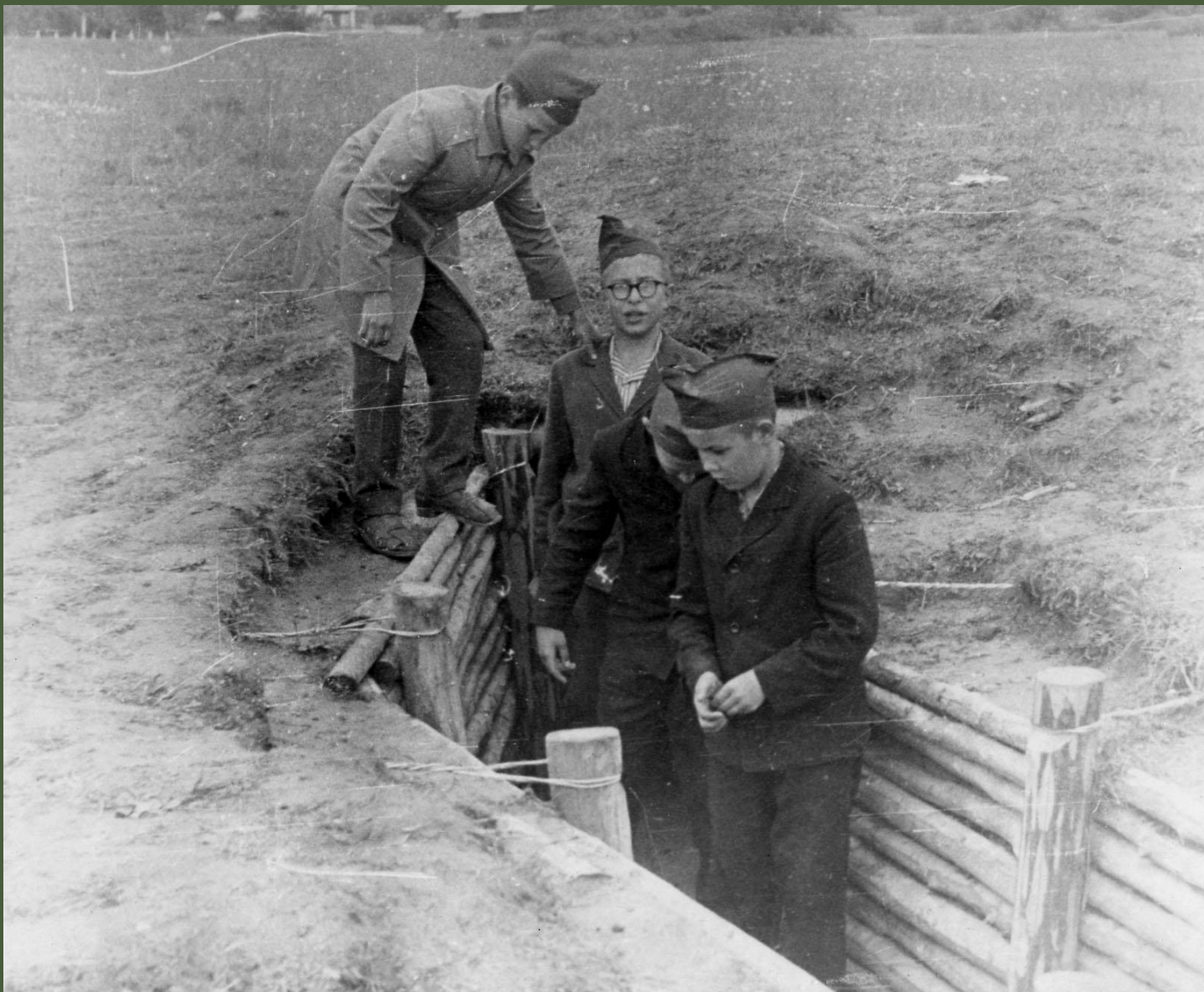
Наши следопыты на месте боя у Дубосеково. 1968 год