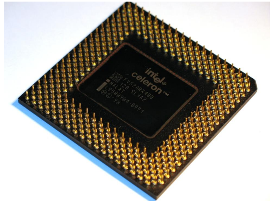
Рис.2 Intel Celeron 400 Socket 370 в пластиковом корпусе PPGA , вид снизу