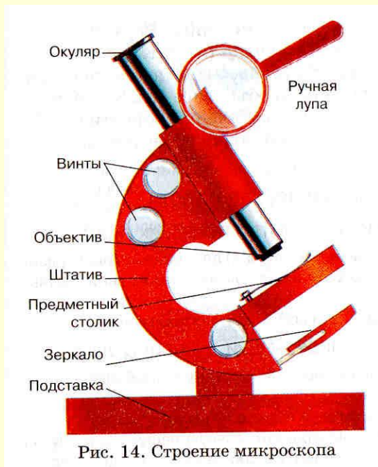
Рис. 14. Строение микроскопа