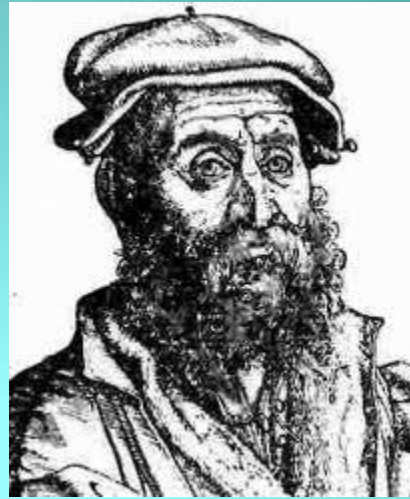
Николо Тарталья [ок.1499-1557]