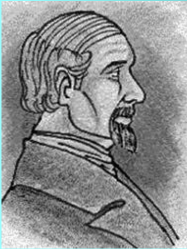
Раффаэле Бомбелли [ок.1530-1572]