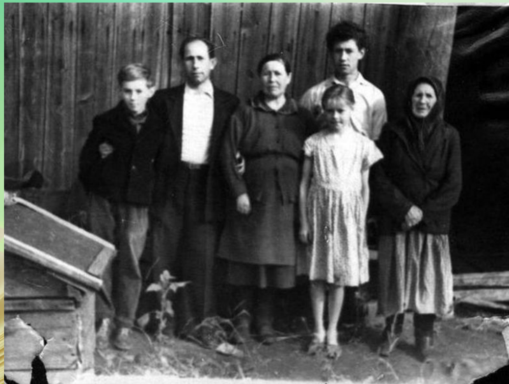
Будущий поэт в кругу своей семьи