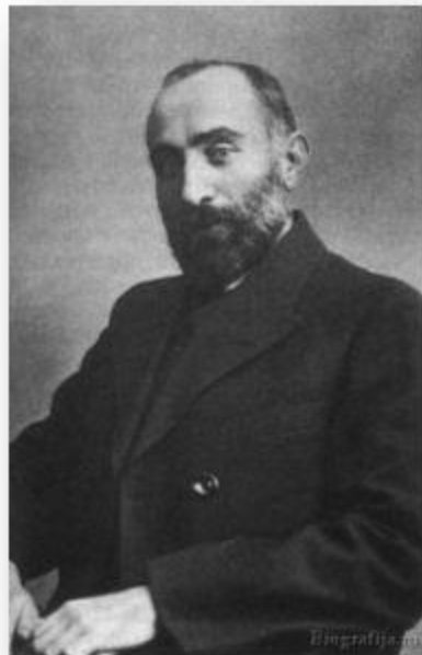
Н.С.Чхеидзе, председатель Исполнительного комитета, меньшевик