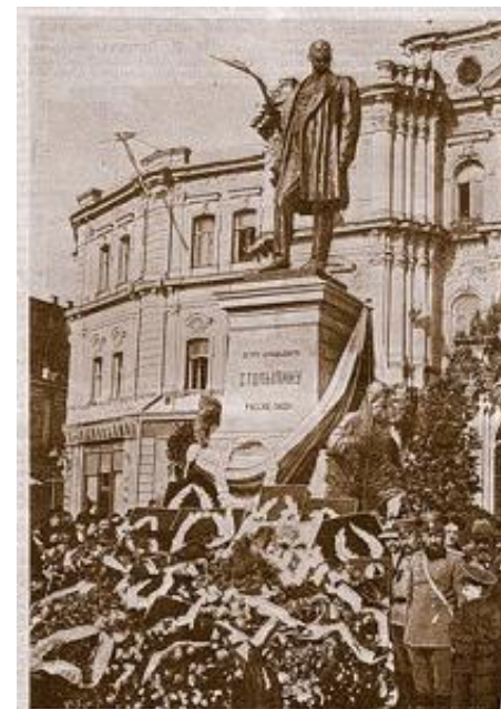
Открытие памятника П.А.Столыпину в Киеве в 1913г.