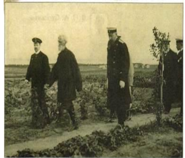
П. А. Столыпин осматривает хуторские огороды близ Москвы. 1910 г. Фотография

Хутор – участок земли, выделенный крестьянину при выходе из общины с переселением из деревни на свой участок.