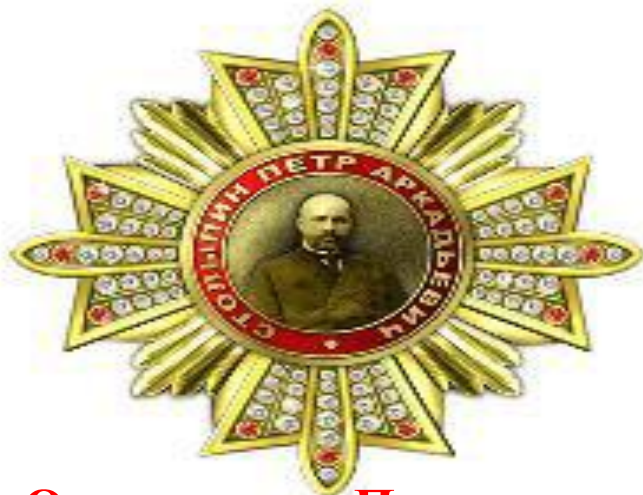
Орден имени Петра Аркадьевича Столыпина Вручается за заслуги в области государственного и муниципального управления