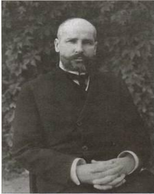
П.А. Столыпин (1862 – 1911 гг.)

«Противникам государственности хотелось бы избрать путь радикализма, путь освобождения от исторического прошлого России, освобождения от культурных традиций.