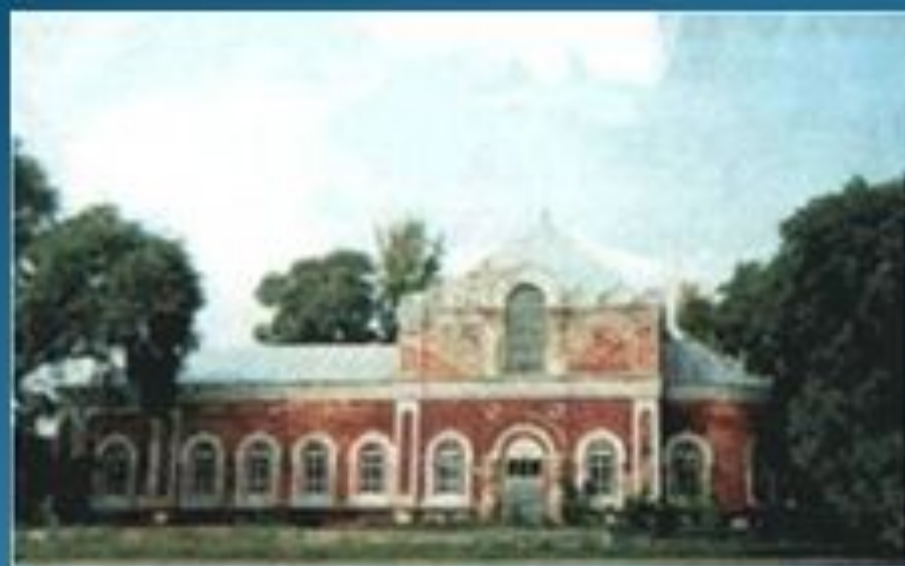
Храм Николая Чудотворца до реставрации