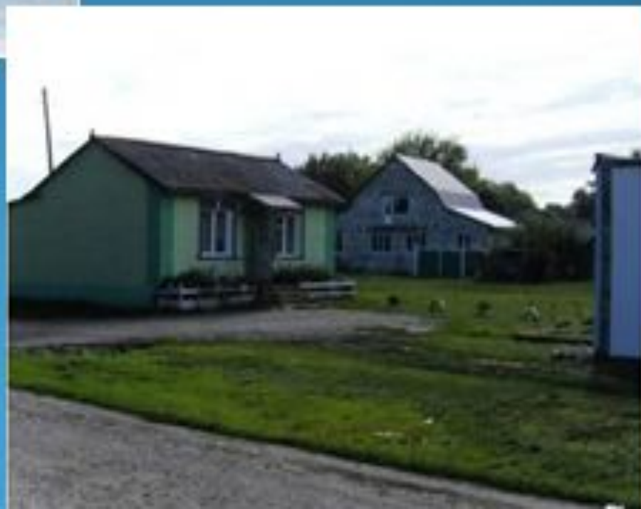
Место, где ранее был клуб