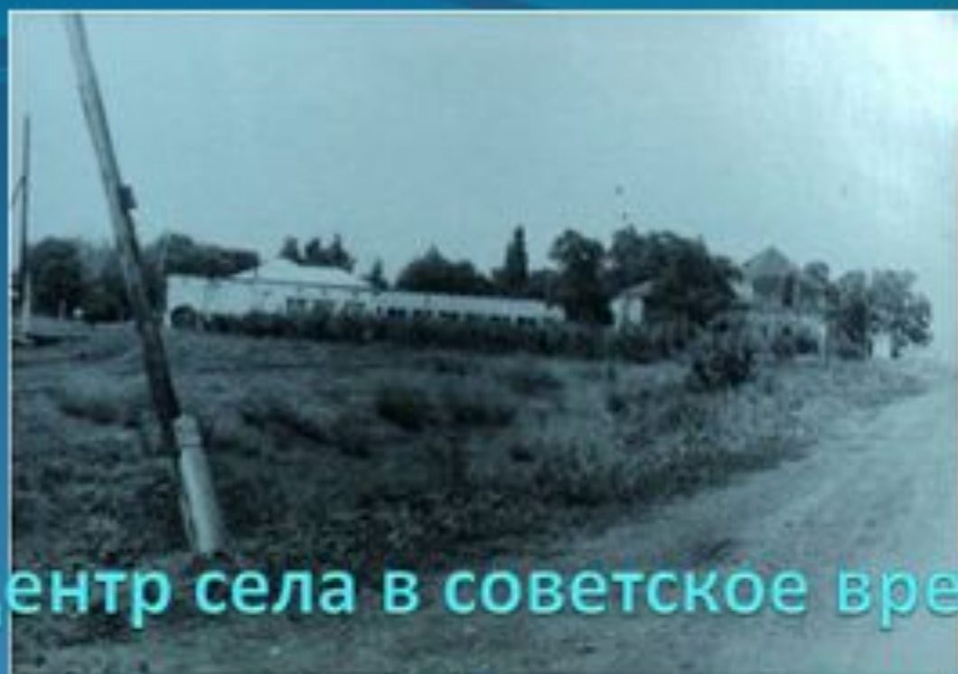
Центр села в советское время