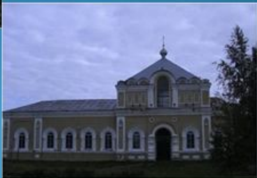
Современный вид храма Николая Чудотворца