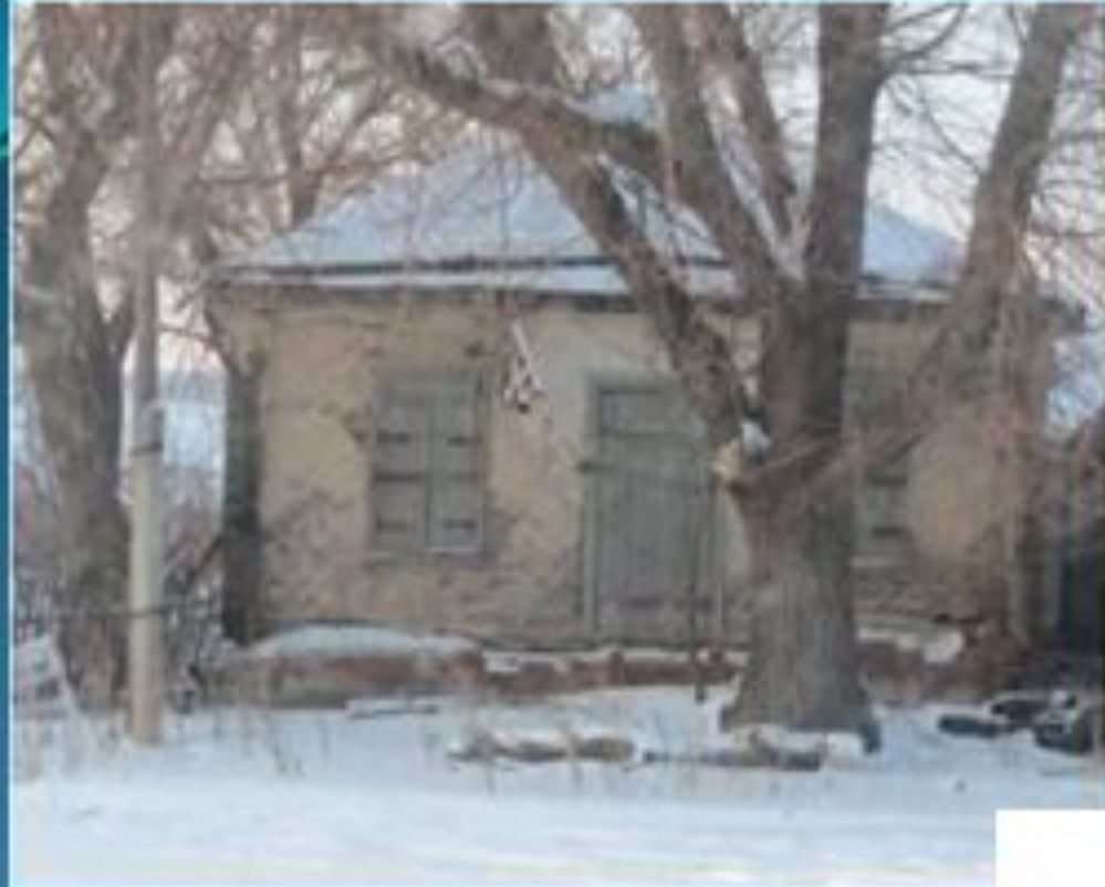
Старое здание магазина