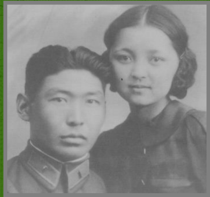
1938 г. Молодые супруги