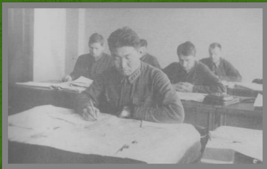
1935-1938 гг. Москва. Военная академия им. М. В. Фрунзе

Годы учебы в военной академии заметно повышают образовательный уровень молодого командира.