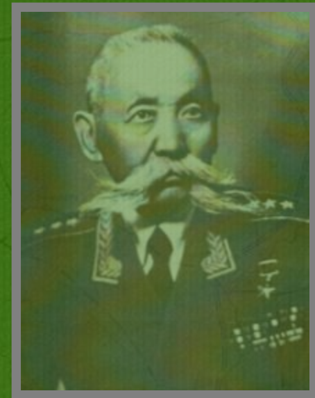
Б. Б. Городовиков