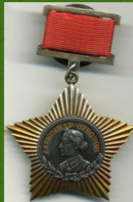
Орден Суворова II степени

На Востоке, в Манчжурии, в августе 1945 года первым применил тактику внезапной нешаблонной ночной атаки на прорыв укрепленного рубежа японцев без артиллерийской подготовки, увенчавшейся полным успехом.