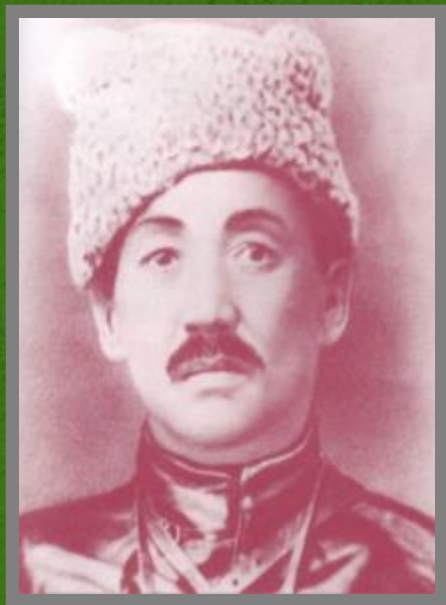
Городовиков О. И.

Переписываясь с дядей, я иногда сообщал ему о своих намерениях строить жизнь на хуторе. Но в ответных письмах он советовал и прямо-таки требовал, чтобы я распродал все свои пожитки и добивался посылки на учебу в Краснодарскую кавалерийскую школу горских национальностей.