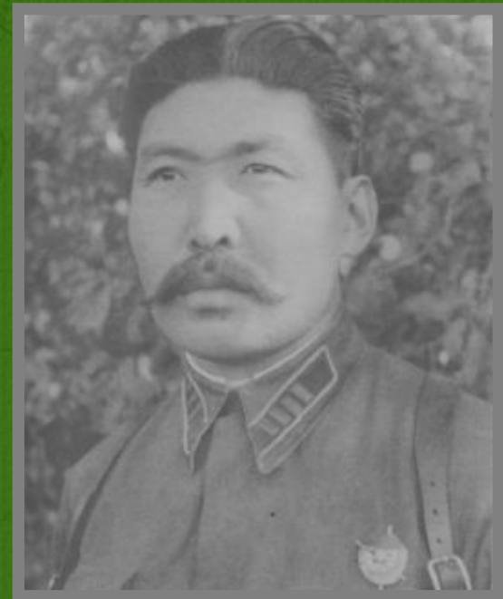
1942 г. Первая боевая награда и звание полковника

Слава о нем гремела по всему Крыму. Командующий II немецкой армией Манштейн вынужден был сообщить в своем донесении Гитлеру, что немецким войскам ни днем, ни ночью не дают покоя в лесах остатки 48-й кавдивизии, которыми командует офицер монгольского происхождения.