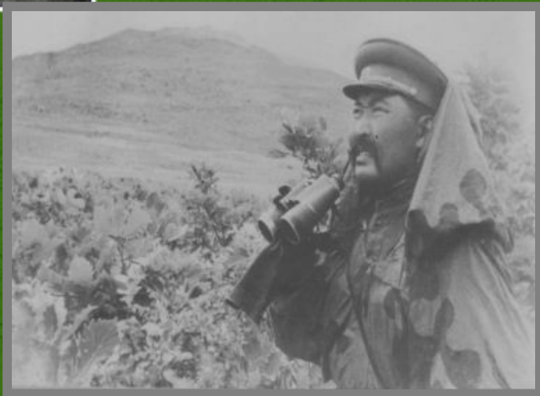
Август 1945 г. Манчжурия. Перед прорывом рубежа Квантунской армии

1945, 26 сентября – награжден орденом Суворова II степени.