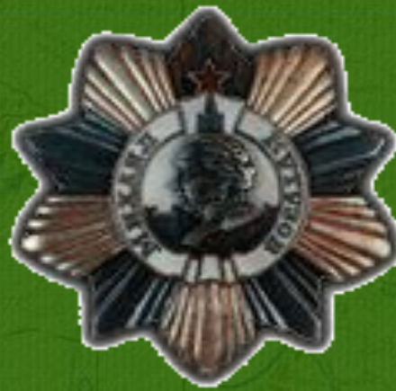
Орден Кутузова II степени