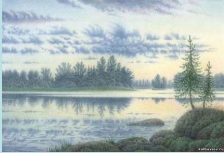
Работа по-сырому. Автор: Владимир Колбасов