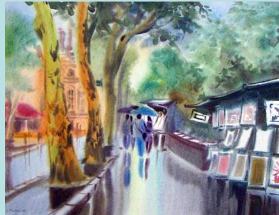
Техника A la Prima. Автор: Катя Михальская