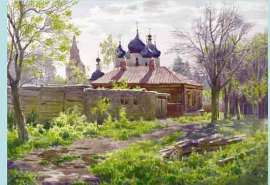
Многослойная акварель (лессировка). Автор: Сергей Николаевич Андрияка