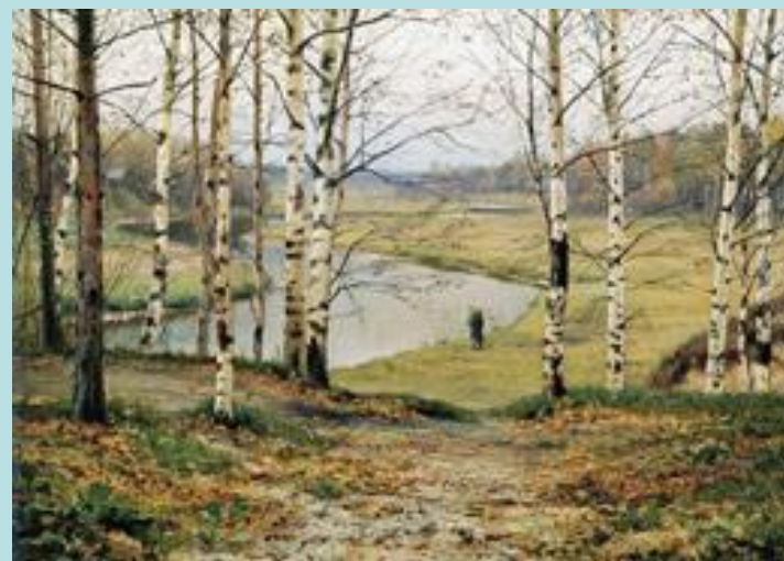
Иллюстрация художника А. Бельюкина на стихи А.Пушкина в книге "Уж небо осенью дышало"