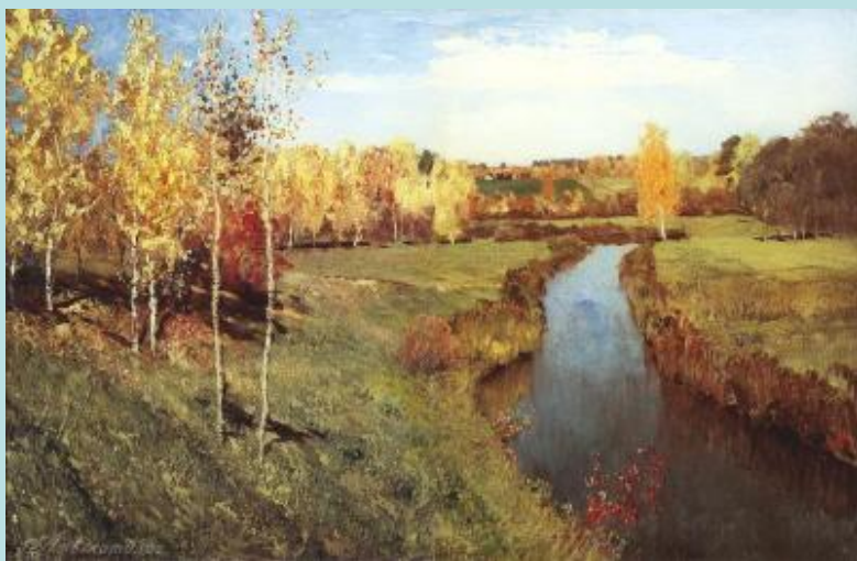
Репродукция картины И.Левитана "Золотая осень"