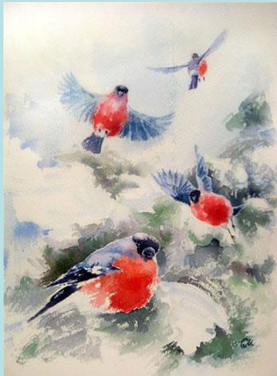
Работа «по-сухому». Автор: Стежко Мария Георгиевна