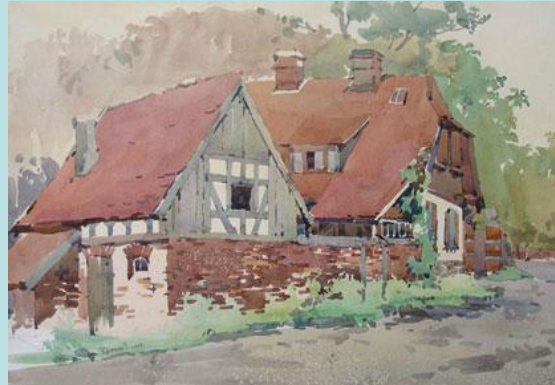
Однослойная акварель «по- сухому». Автор: Игорь Юрченко