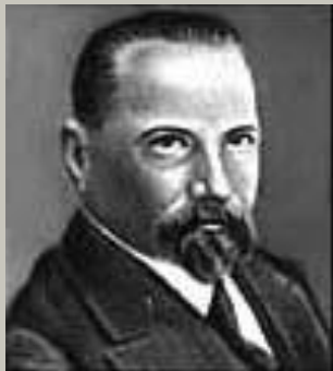
Цандер Ф. А.