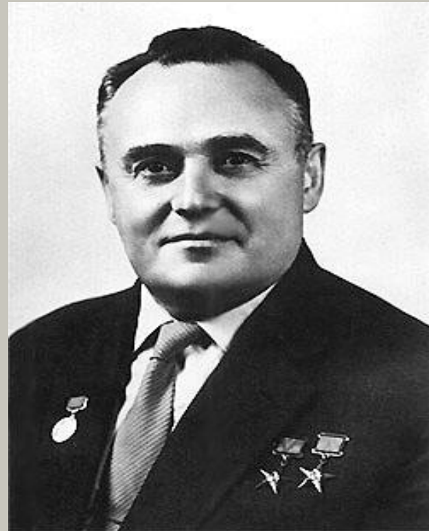
Королев С. П. (1907 – 1966)