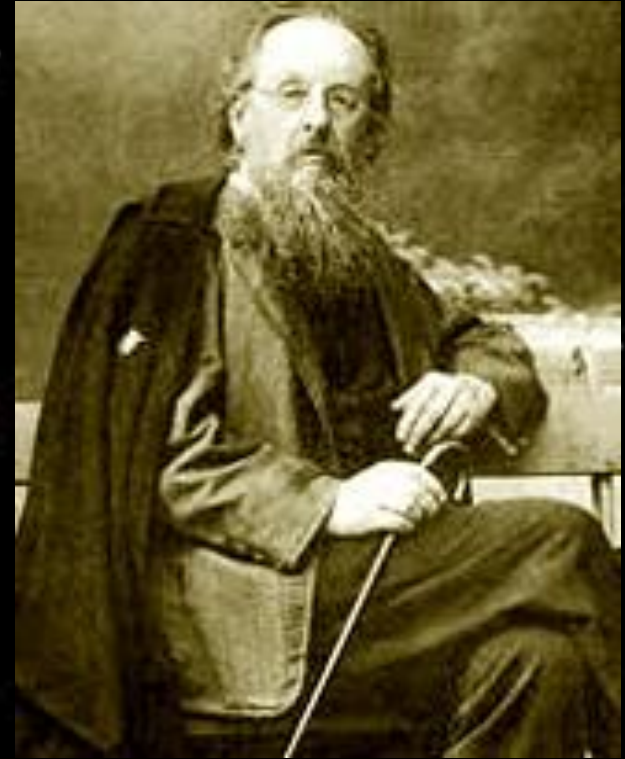
Циолковский К. Э. (1857 – 1953 )

Высказал идею бортовой системы ориентации по Солнцу или другим небесным светилам;