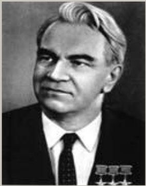
Келдыш М. В.