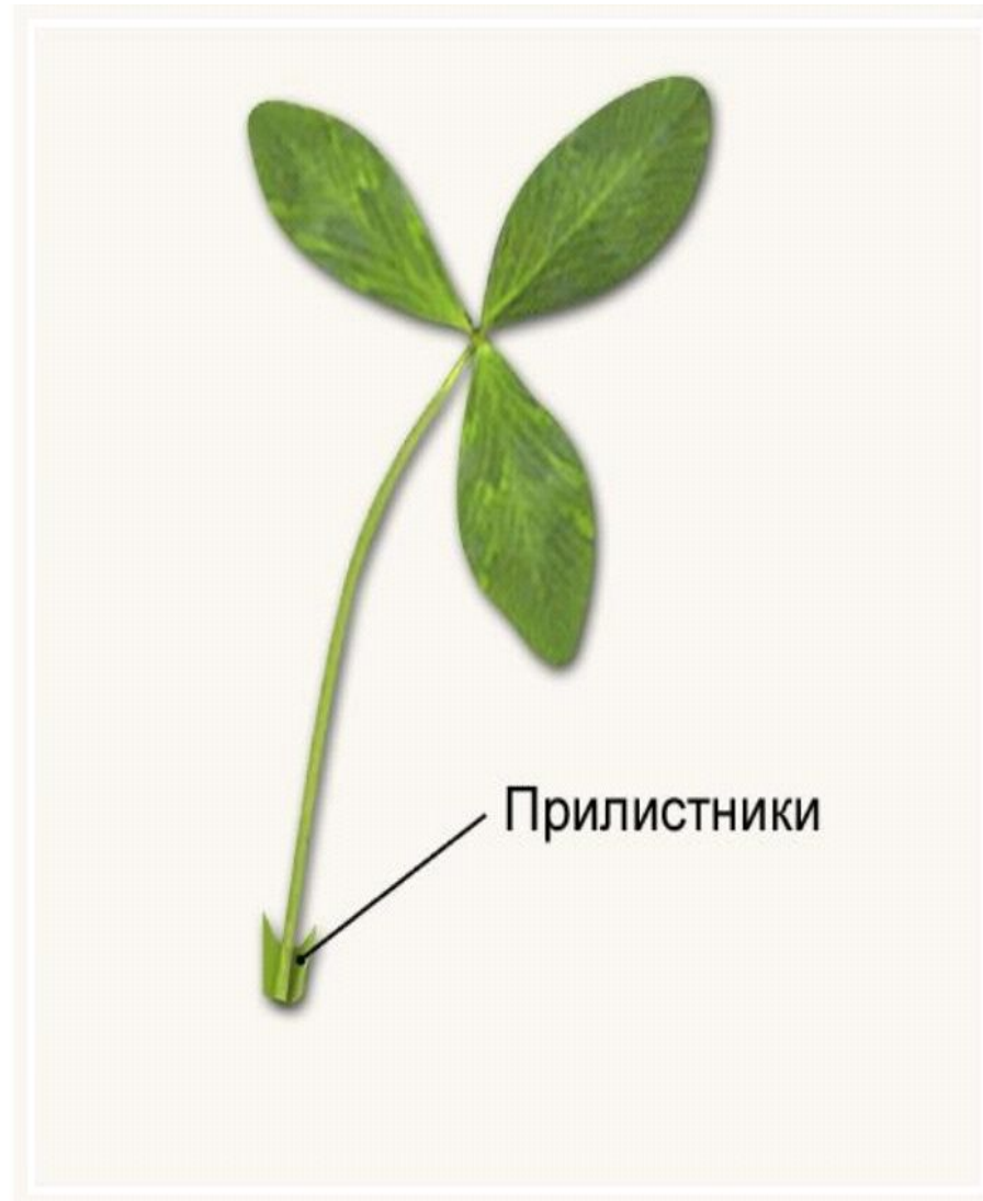
Прилистники у листа клевера.