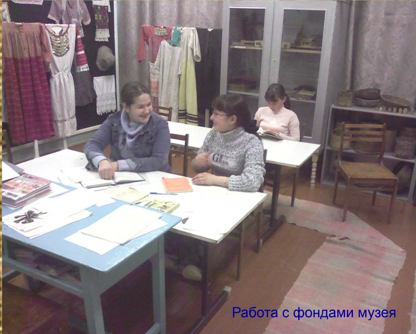
Работа с фондами музея