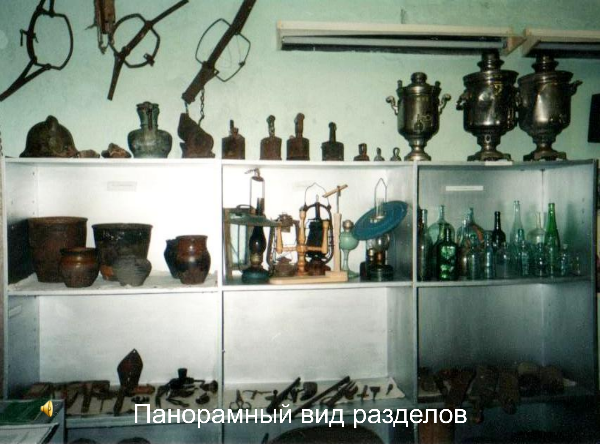
Панорамный вид разделов