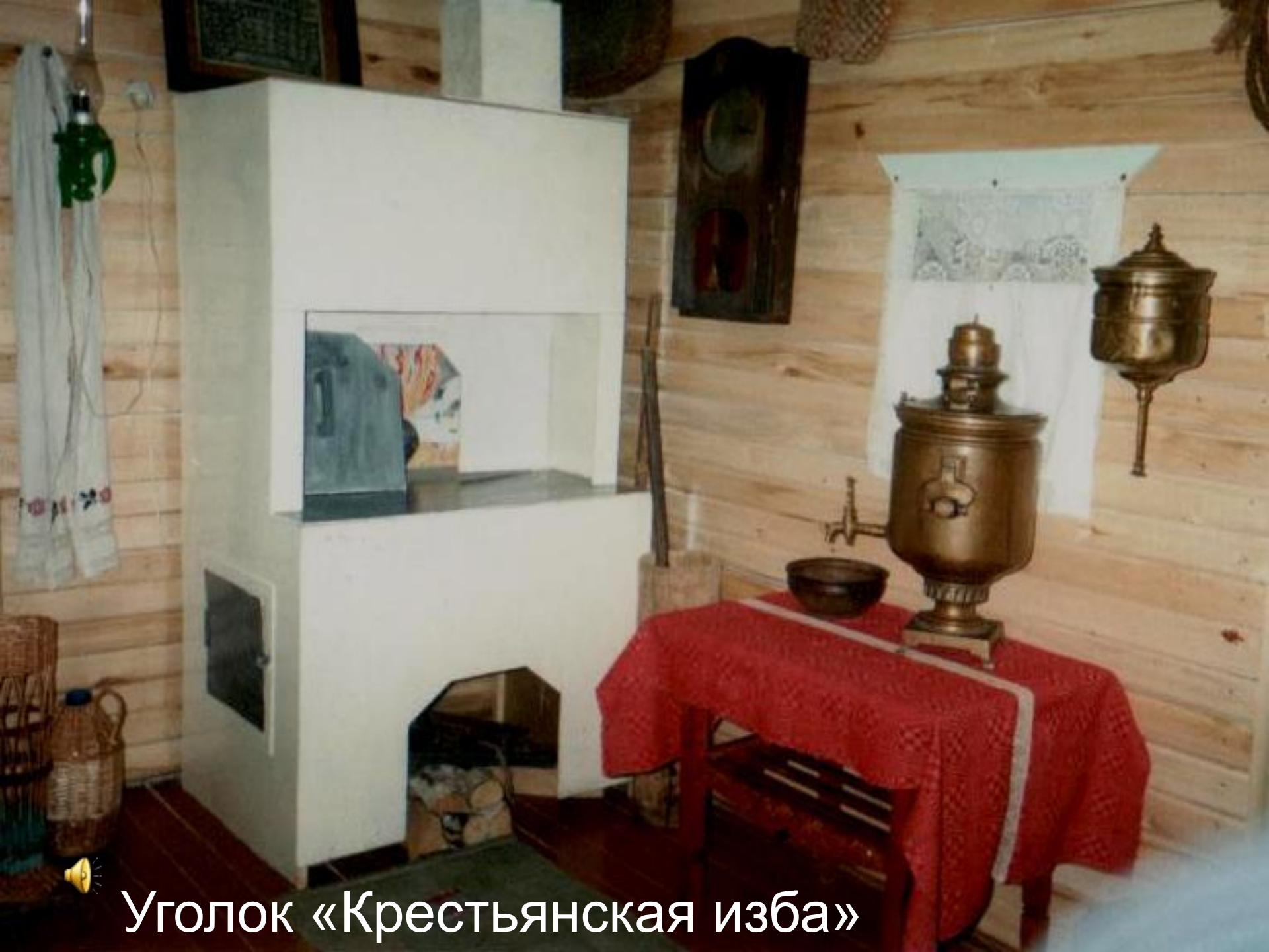
Уголок «Крестьянская изба»