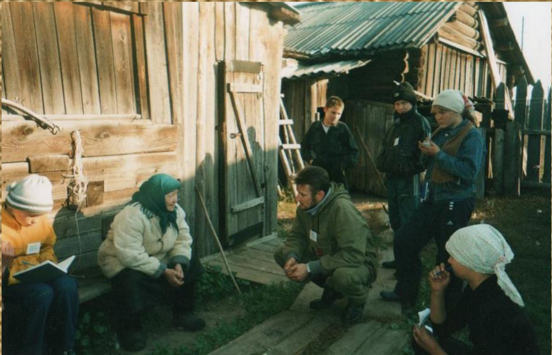
Опрос местного населения и сбор полевой информации