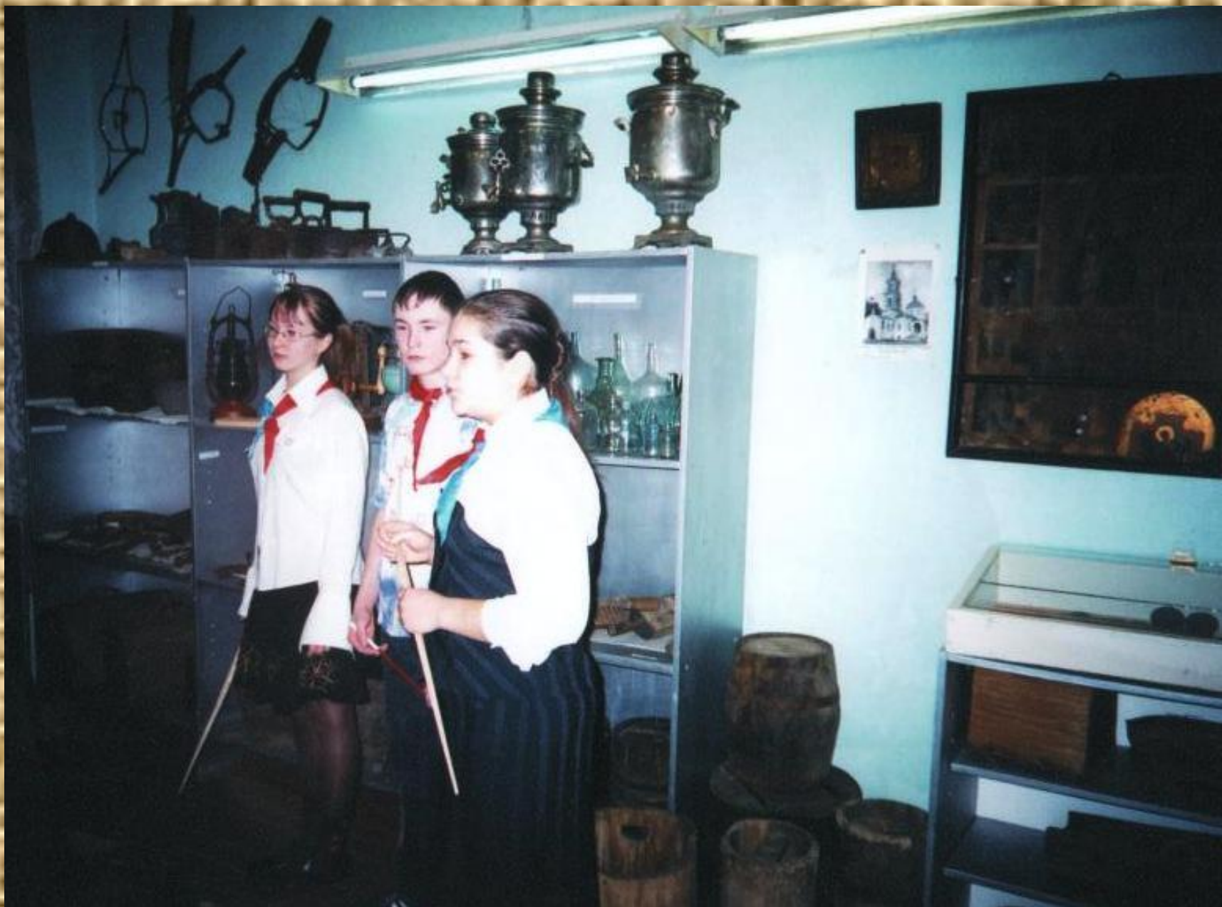
Экскурсионная работа в школьном музее