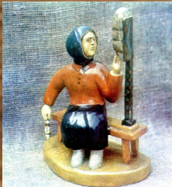
Работы М.В. Абашева из фонда Удмуртского музея изобразительных искусств