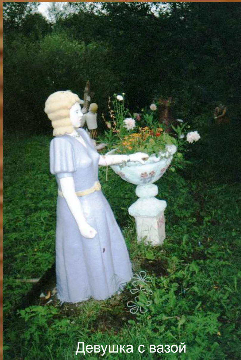
Девушка с вазой