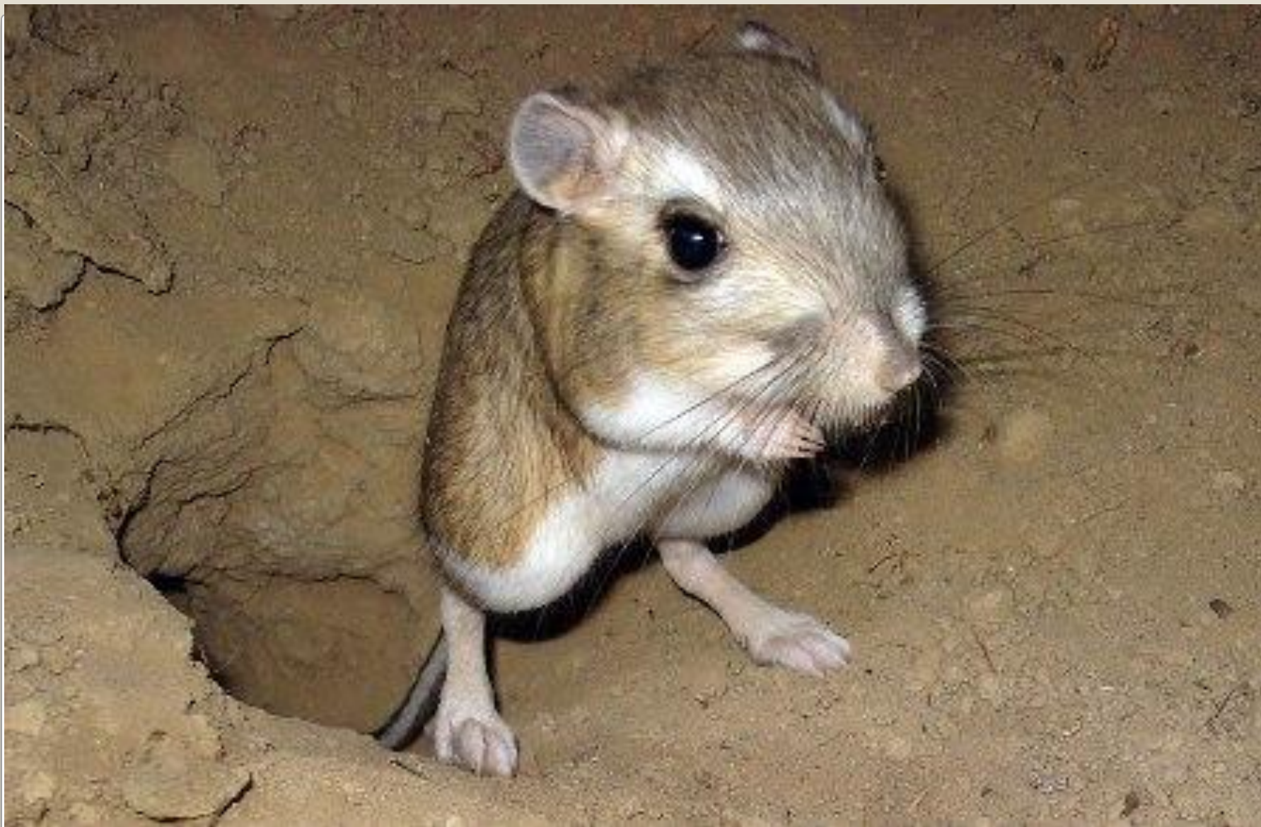
Большой тушканчик (Красная книга Нижегородской области)