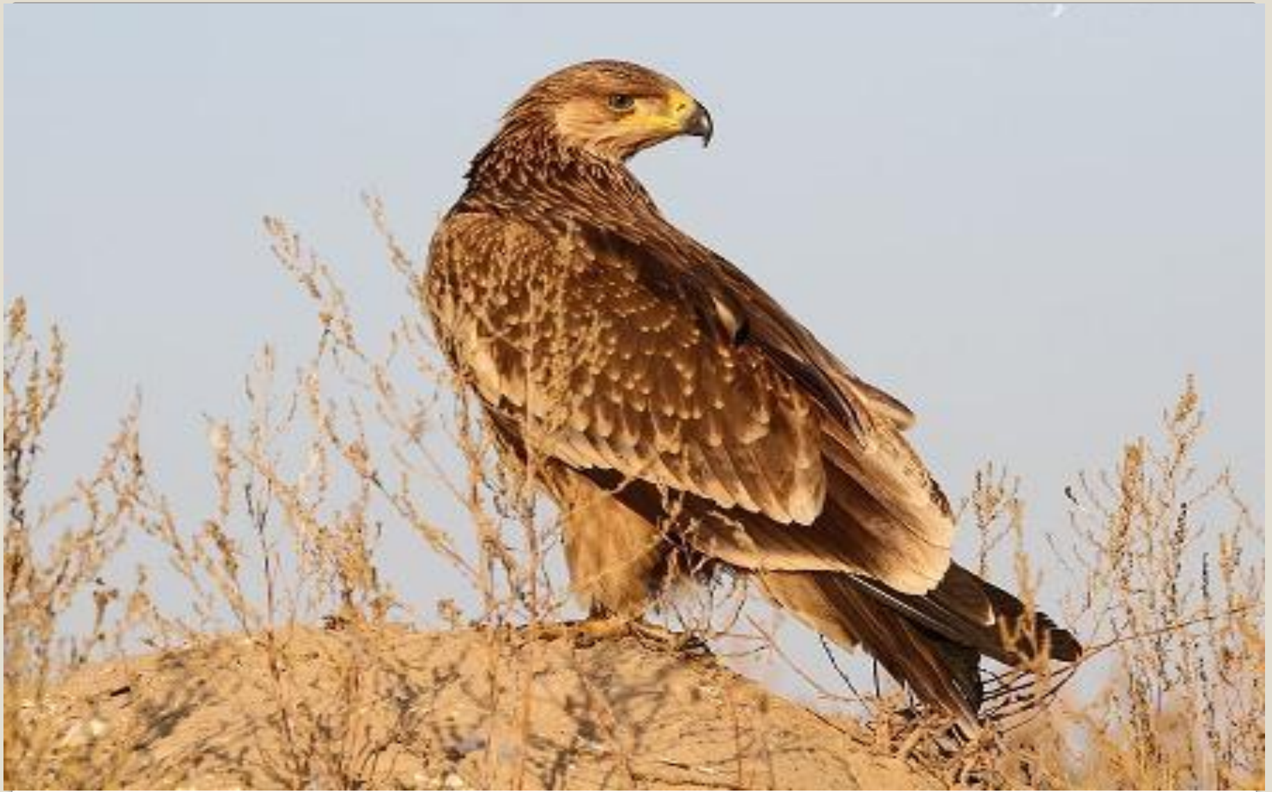
ОРЕЛ - МОГИЛЬНИК