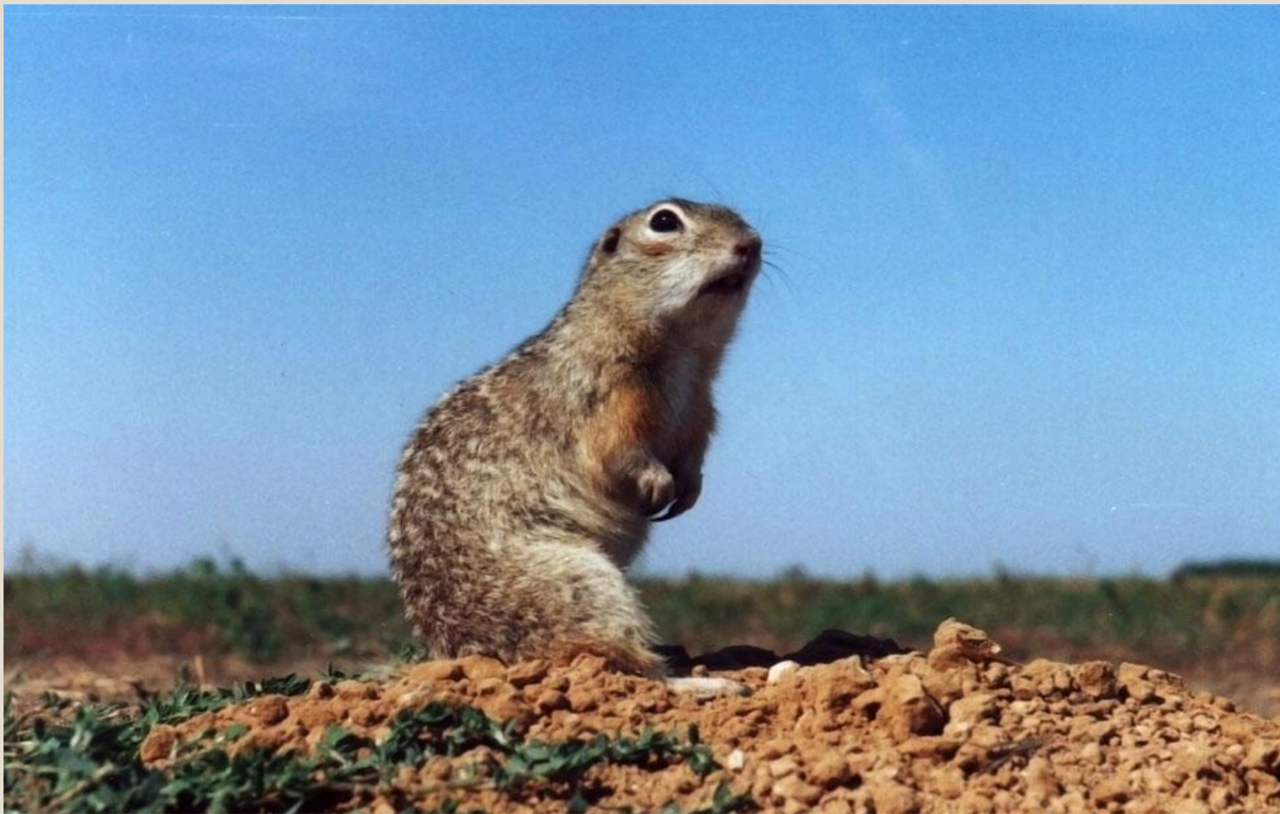
Крапчатый суслик (Красная книга Нижегородской области)