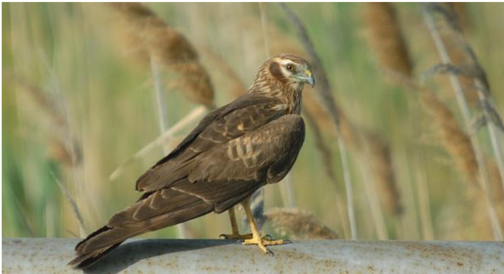
Степной лунь (глобально редкий вид, Красная книга России)