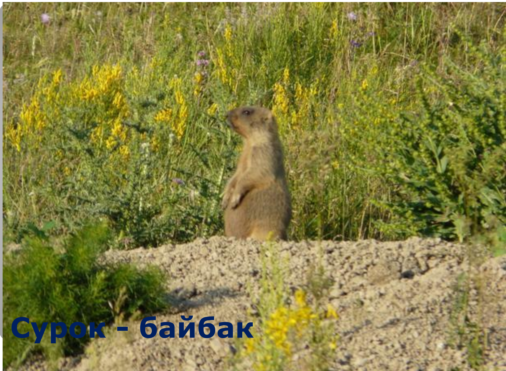
Сурок - байбак