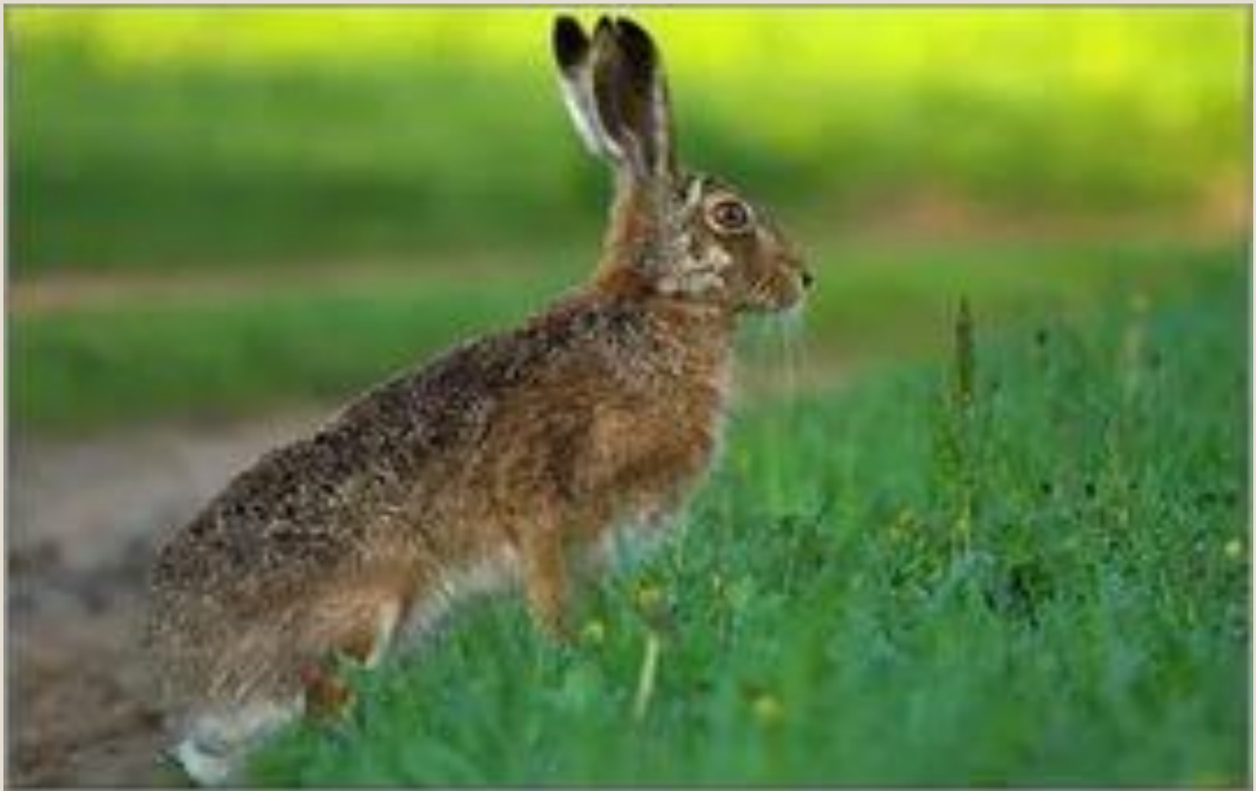
ЗАЯЦ - РУСАК