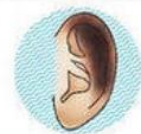
III степень – омертвление окружающих частей кожи