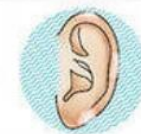
II степень – образование пузырей на коже