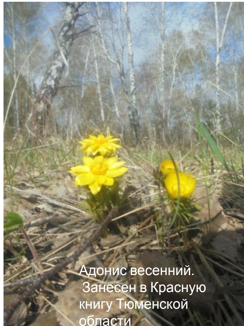
Адонис весенний. Занесен в Красную книгу Тюменской области

Для развития этого вида туризма окрестности города Ишима располагают природными рекреационными ресурсами . Это ООПТ Синицинский бор, Ишимские бугры, Солёные озера.