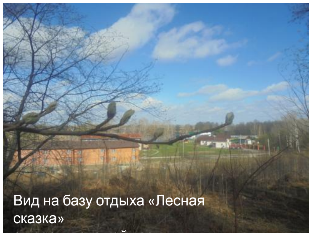
Вид на базу отдыха «Лесная сказка»