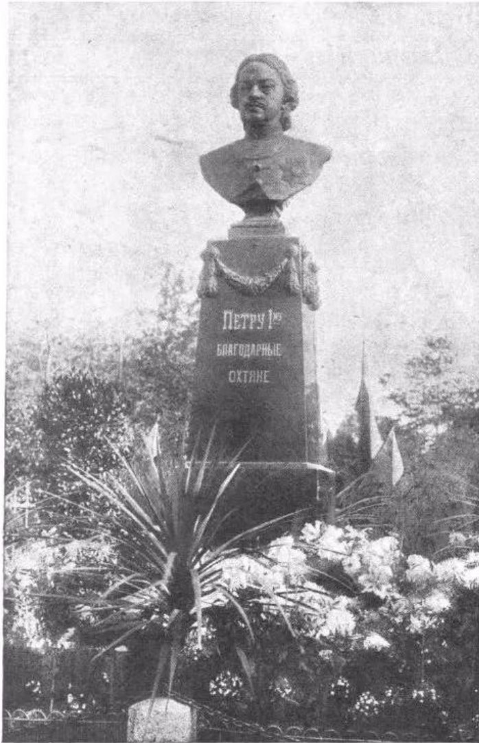
Памятникъ Императору ПЕТРУ I у церкви Св. Духа на Большой Охтѣ, отирытый 25 сентября.