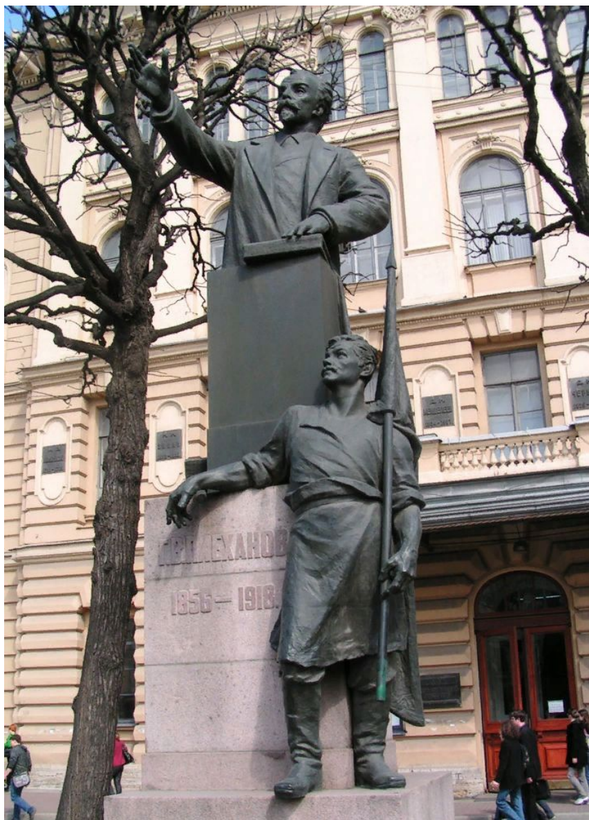
памятник Г. В. Плеханову (1921–1925) Санкт-Петербург