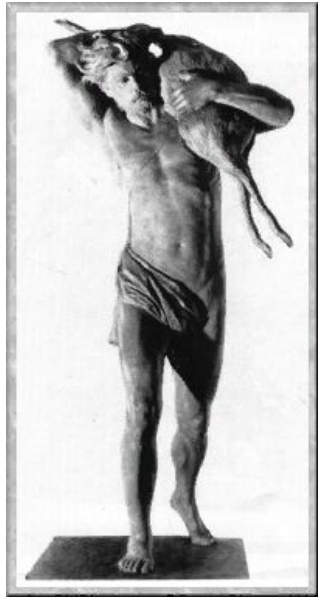
Носильщик, несущий на одном плече тяжесть убитого зверя. 1885. Гипс