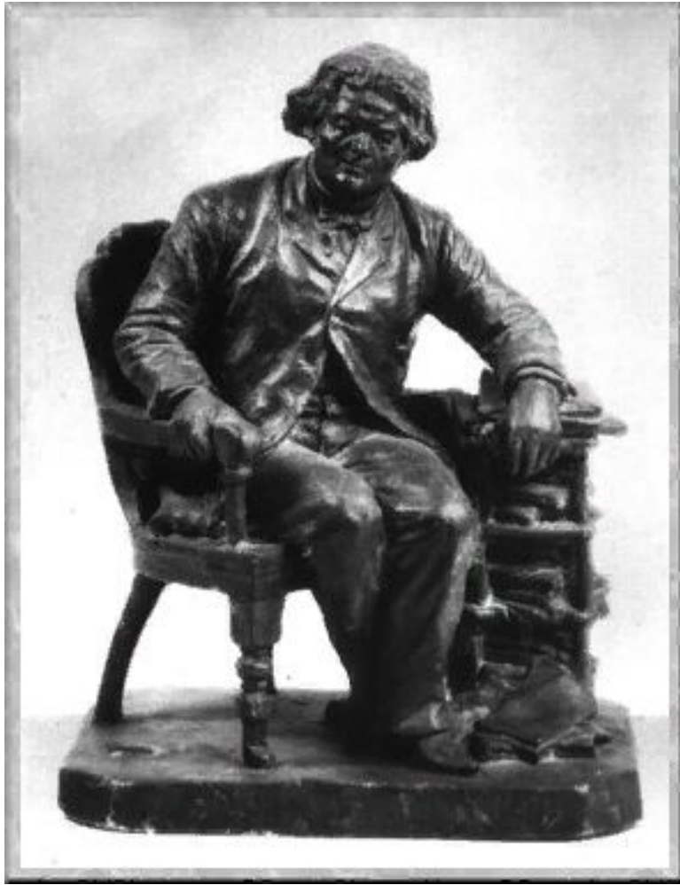
Портрет композитора и пианиста А. Г. Рубинштейна. 1898. Гипс