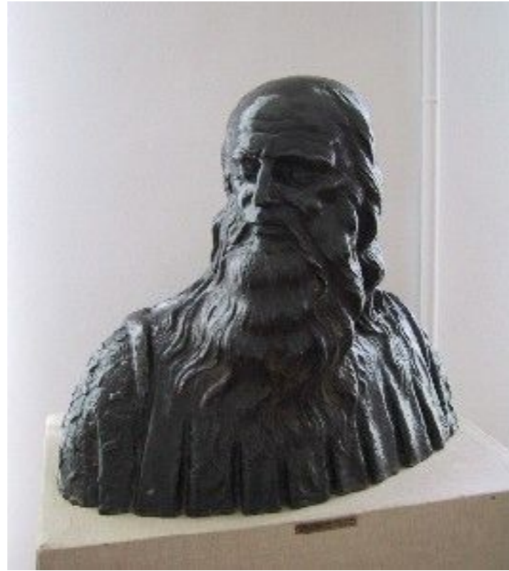
Портрет Леонардо да Винчи 1908 год бронза