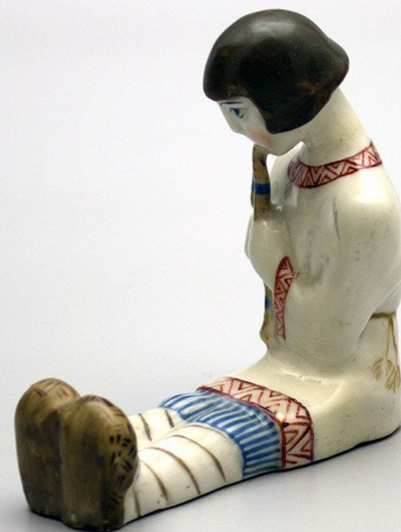
Статуэтка «Лель», фарфор ЛФЗ, 1920-е годы