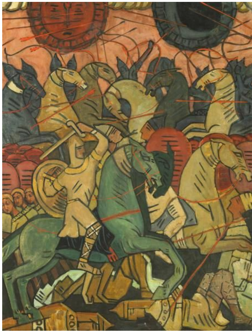
декоративное панно «Сражение»