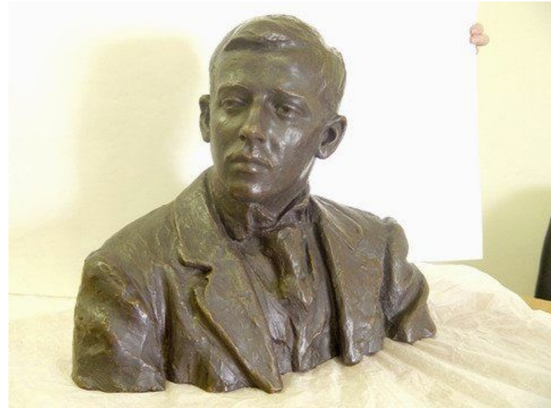
ПОРТРЕТ НИКОЛАЯ ЕВГЕНЬЕВИЧА ЛАНСЕРЕ, БЮСТ Ок 1910 года