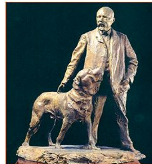
Портрет Василия фон Анрепа с собакой Шамилем. 1906.

Судя по сохранившимся письмам Стеллецкого, часть которых хранится в архивах Русского музея, это был человек, прежде всего глубоко ценящий национальное русское искусство. Он до самозабвения увлекался древнерусской культурой, народным декоративным творчеством. Изучал также современное и классическое искусство за рубежом. Эти глубокие знания он успешно применял и в книжной графике, и в керамике.