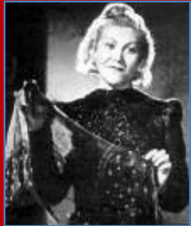
муз. Е. Петербурского, сл. Я.Галицкого