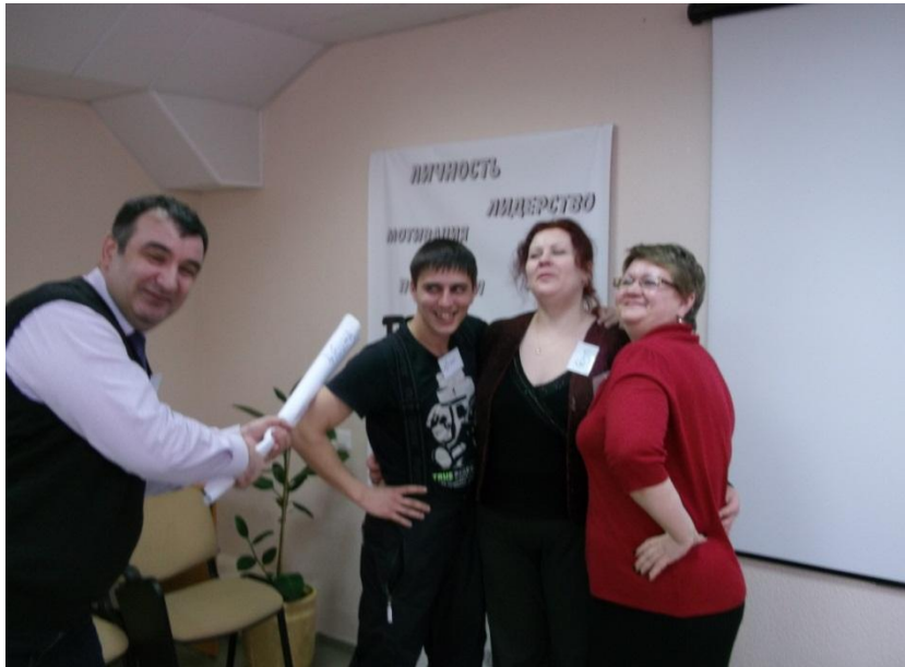
Сотрудники «Отличена» Г.Киров

«Тренинг «Целеполагание и Тайм-менеджмент» научил планировать рабочий день, выставлять приоритеты в поставленных задачах, легче стало ставить цели и выстраивать путь к их достижению»