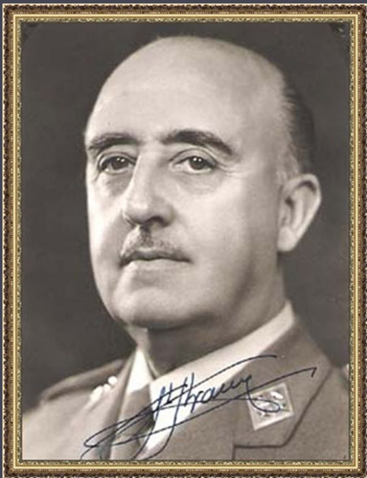
Генерал Ф. Франко