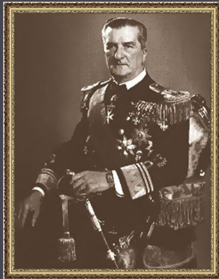
Адмірал М. Хорті.