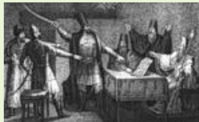
Руководители 1 ополчения