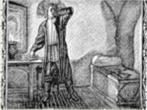
Григорий Отрепьев в монастыре

В 1602 г. в Польше объявился человек, который выдавал себя за чудом спасшегося царевича Дмитрия, младшего сына Ивана Грозного.