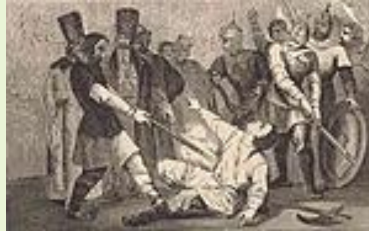
Смерть самозванца 16 мая 1606 г.

На рассвете 16 мая 1606 года вооруженный отряд под руководством В.И.Шуйского вошел в Кремль. С криком «Измена!» Лжедмитрий I попытался убежать, но был жестоко убит. Его труп подвергли торговой казни, посыпали песком, мазали дегтем. Среди жителей Москвы царевубийство вызвало неоднозначную реакцию, многие плакали, глядя на поругание. Его сначала похоронили в так называемом «убогом доме», кладбище для замёрзших или упившихся, за Серпуховскими воротами.