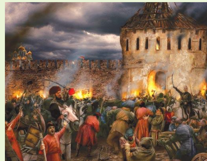
Созыв I ополчения в Рязани.