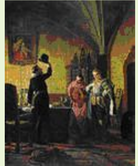
Лжедмитрий I присягает польскому королю

Польский король Сигизмунд III поддержал Лжедмитрия I и предоставил ему 4- тысячный военный отряд.