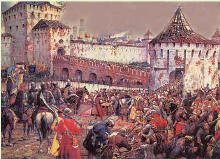
Капитуляция польского гарнизона в Москве