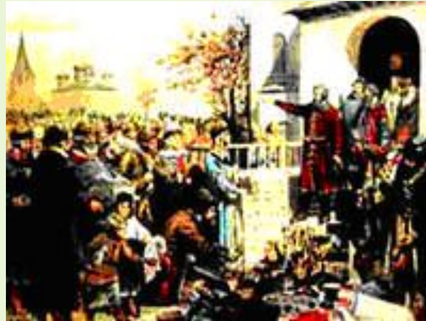
Минин призывает народ к пожертвованию