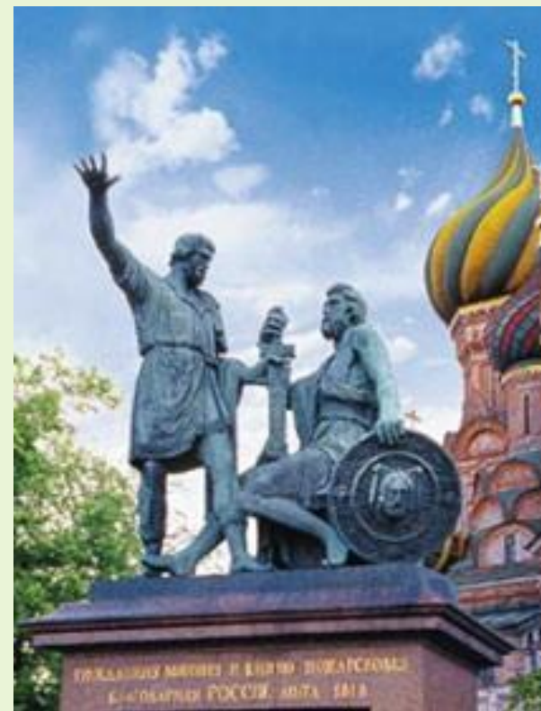
Памятник Минину и Пожарскому в Москве на Красной площади