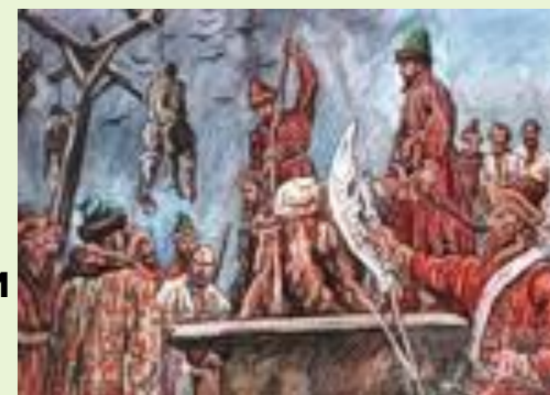
Расправа с восставшими

Болотников И.И. – предводитель восстания. Беглый холоп. Называл себя воеводой спасенного царевича Дмитрия. Восстание переросло в народную войну. Его поддерживали крестьяне, горожане, стрельцы, казаки и дворяне, верившие Лжедмитрию I.