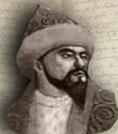
(1598 — 1628) «ЕСКІ ЖОЛЫ» (ДРЕВНИЙ ПУТЬ) ЕСІМ ХАН