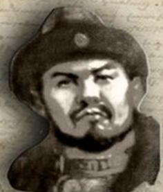
(1445–1518) «ҚАСҚА ЖОЛЫ» (СВЕТЛЫЙ ПУТЬ) ҚАСЫМ ХАН