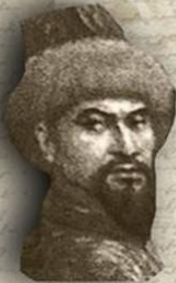
(1626–1718) «ЖЕТІ ЖАРҒЫ» (СЕМЬ ЗАКОНОВ) ТӘУКЕ ХАН