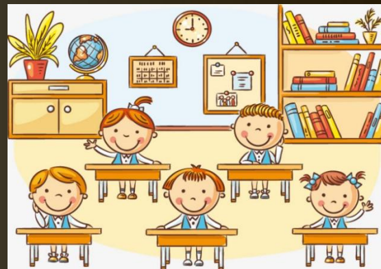
Дети, учащиеся в одном классе