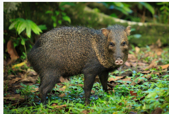
Мексиканская свинья пекари