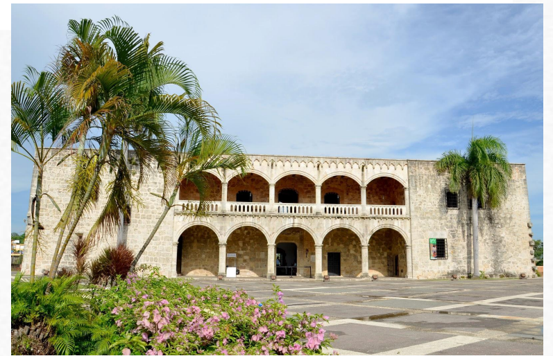
Алькасар-де-Колон (Санто Доминго, Доминикана)