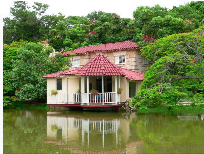
Гуама – речной курорт (Варадеро, Куба)