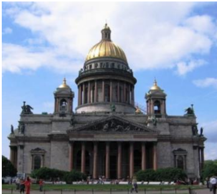
Монферран Исаакиевский собор (1858)