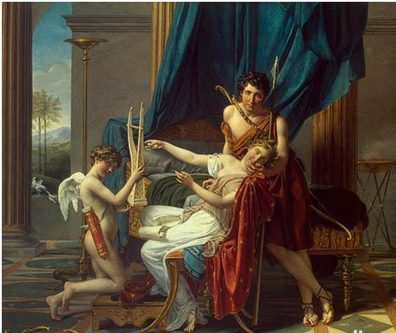
Давид. «Сафо и Фаон».