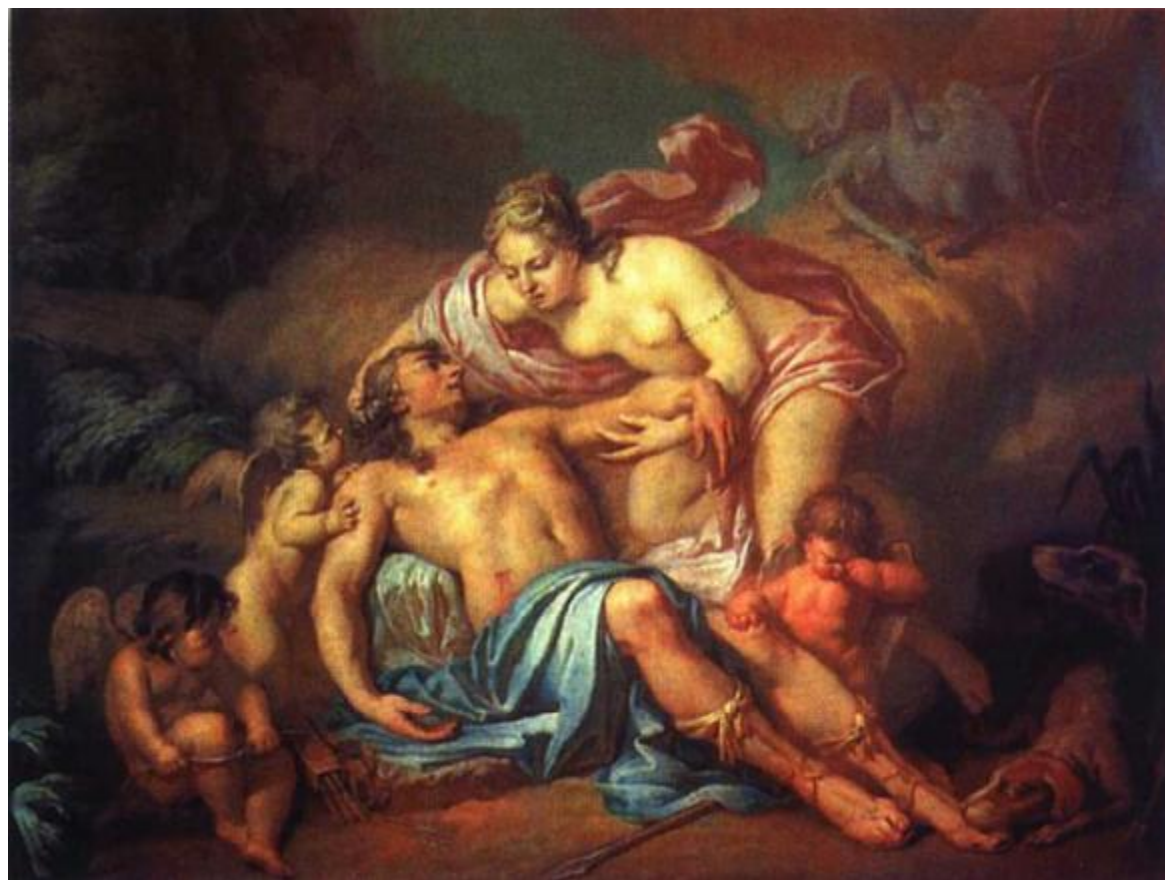
А.П. Лосенко. «Смерть Адониса ».