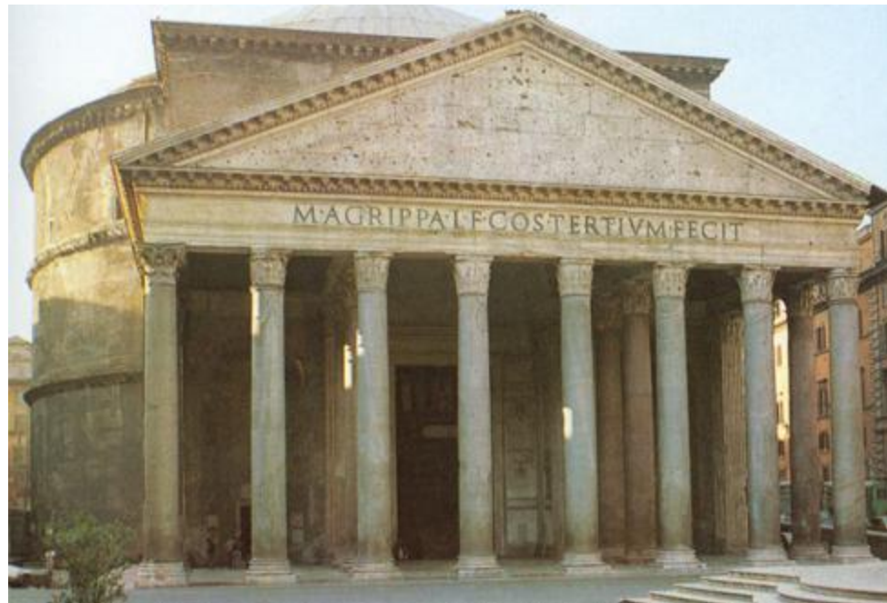
Пантеон в Риме (около 125 года н.э.)