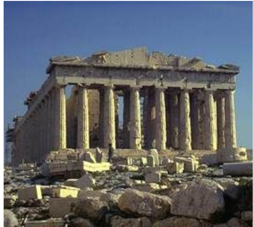
Парфенон в Афинах (V век до н.э.)