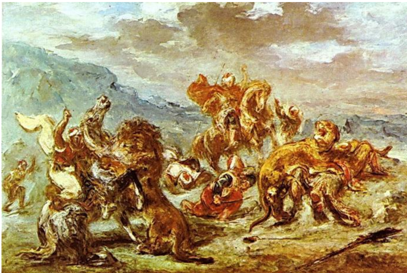
Делакруа. «Охота на львов».