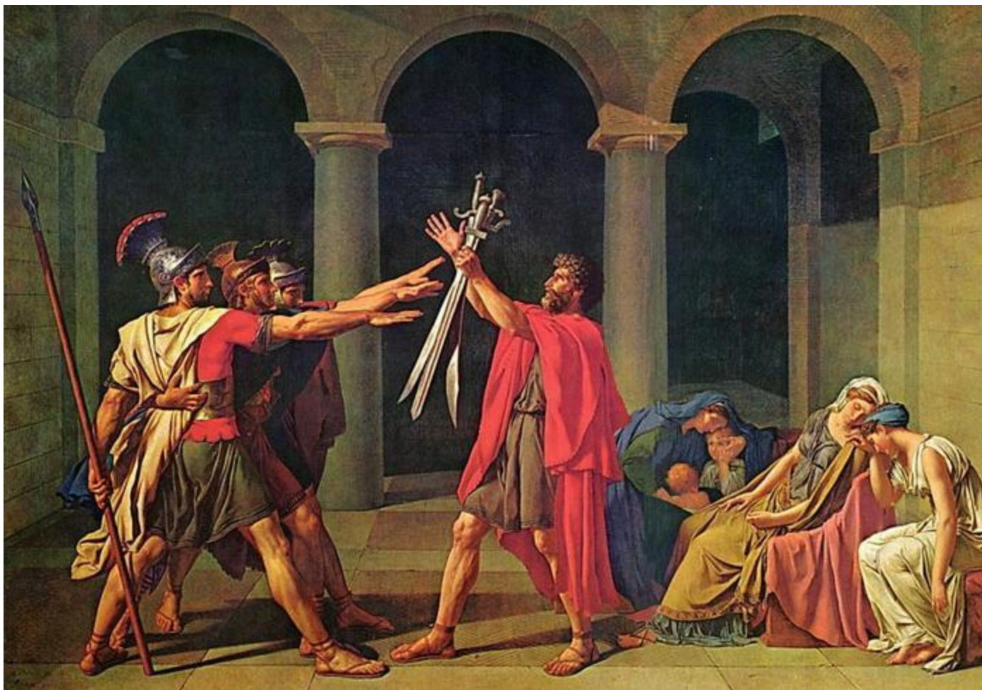
Давид. «Клятва Горациев ».