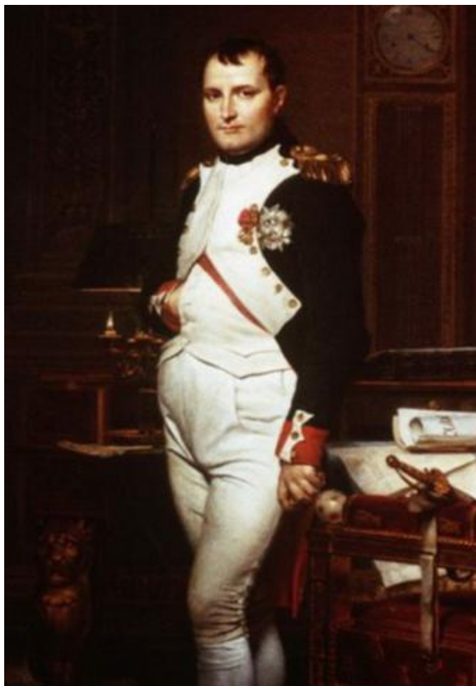
Давид. «Портрет Наполеона в его рабочем кабинете».