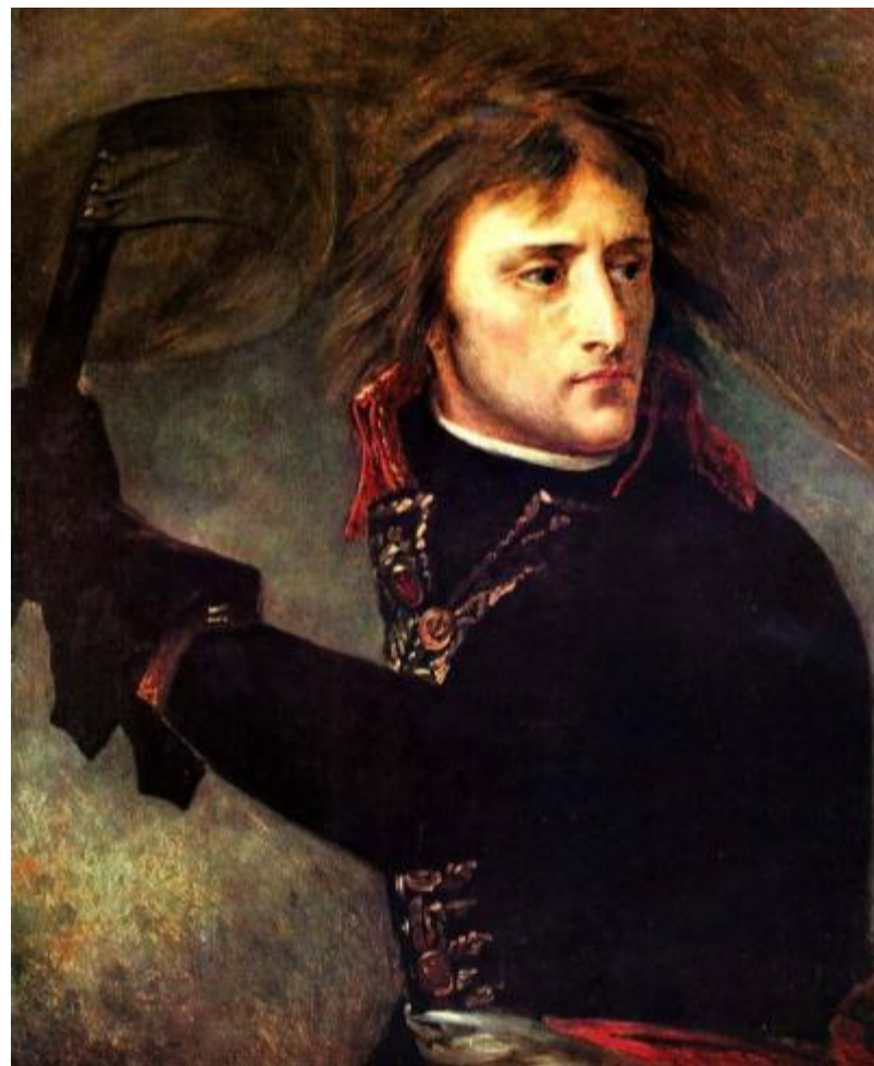
Гро. «Наполеон на Аркольском мосту».