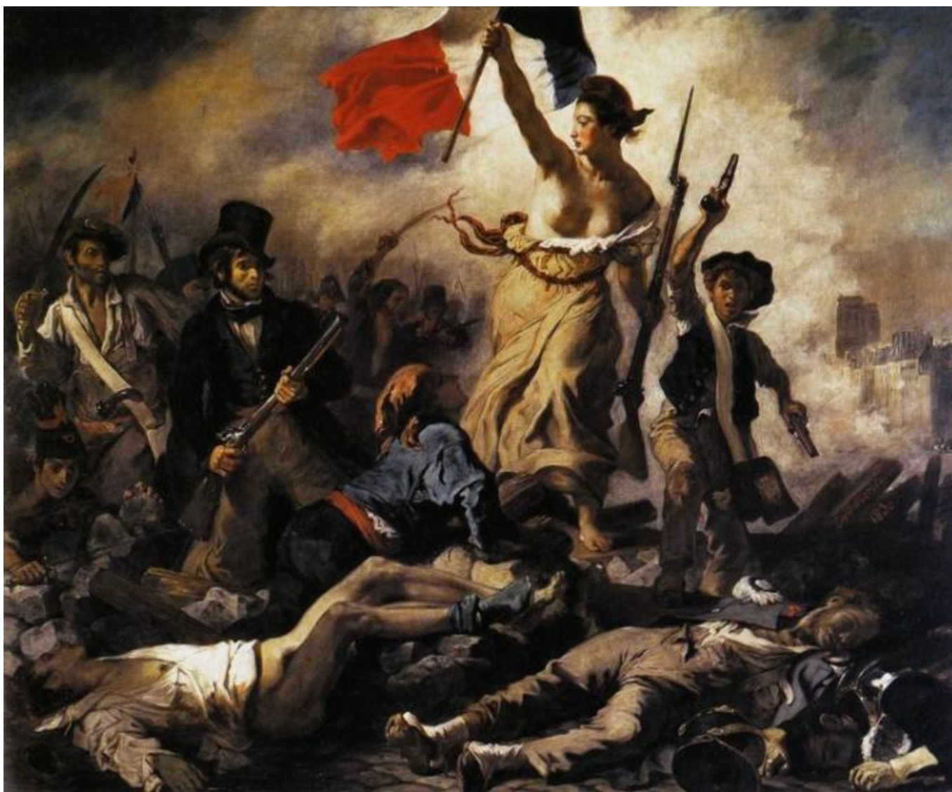
Делакруа. « Свобода на баррикадах ».