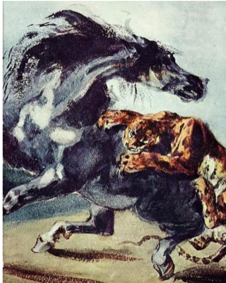
Делакруа. «Тигр, напавший на лошадь».