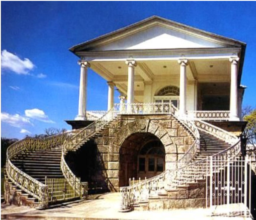
Камеронова галерея в Царском Селе (1793)