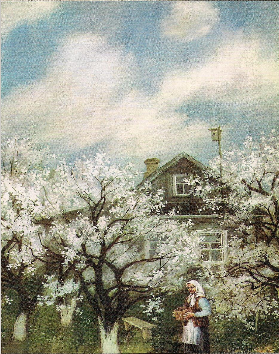
С.Бордюга. Иллюстрация к рассказу «Живое пламя»