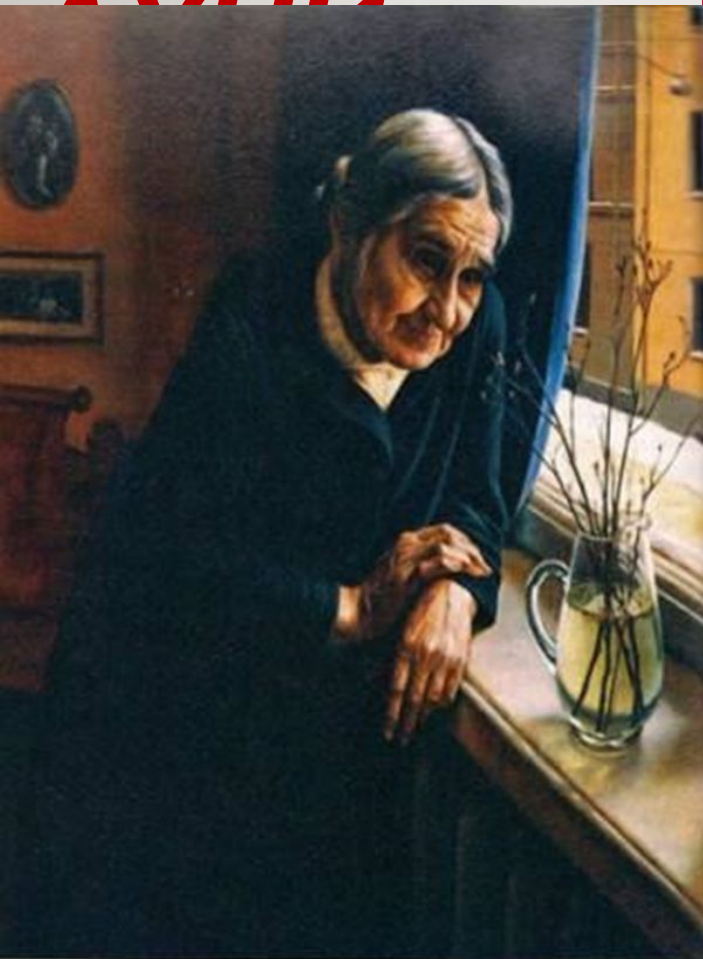
А.Щеголов. Защел багульнич. 1980

«Сын и дочь свили гнездо в городе и наезжали редко -хорошо, коли раз в год.