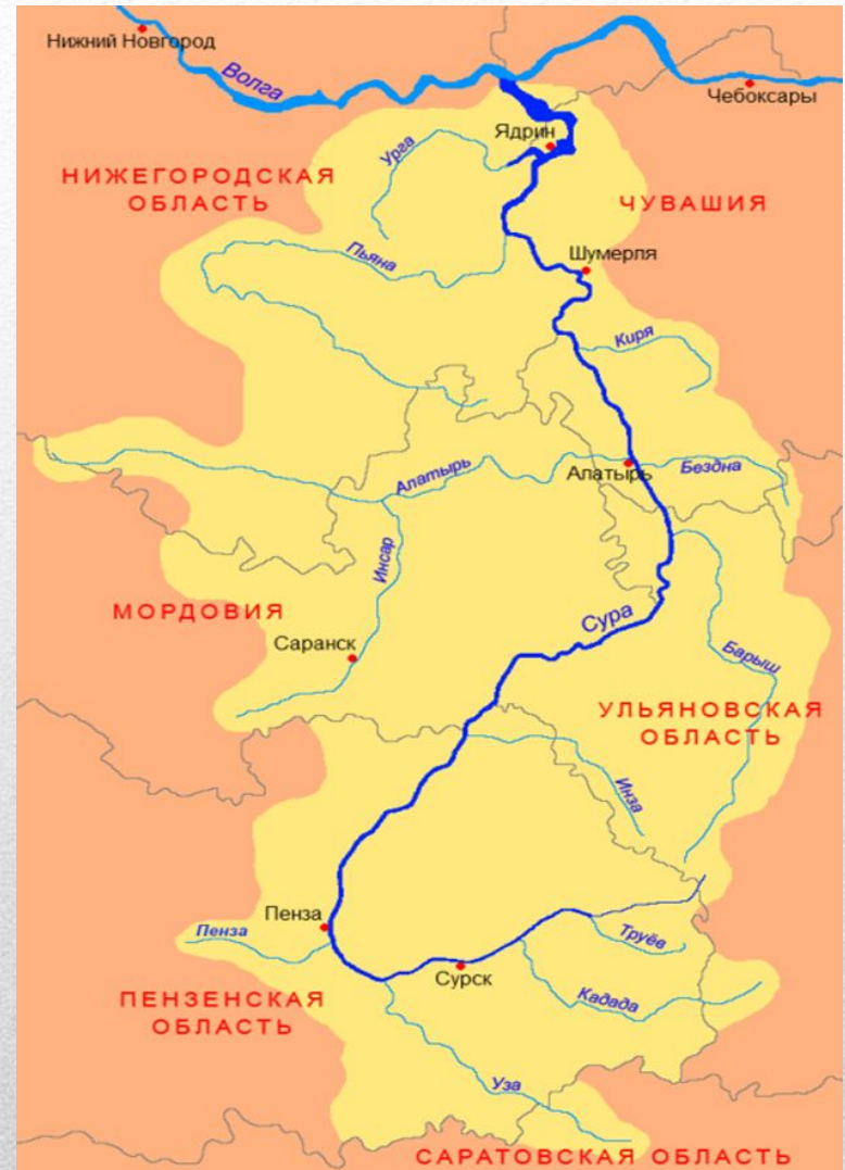
Бассейн реки Сура