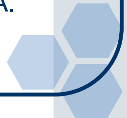
рис. Д.1.2 – другий рисунок першого розділу додатка Д; формула (А.1) – перша формула додатка А.