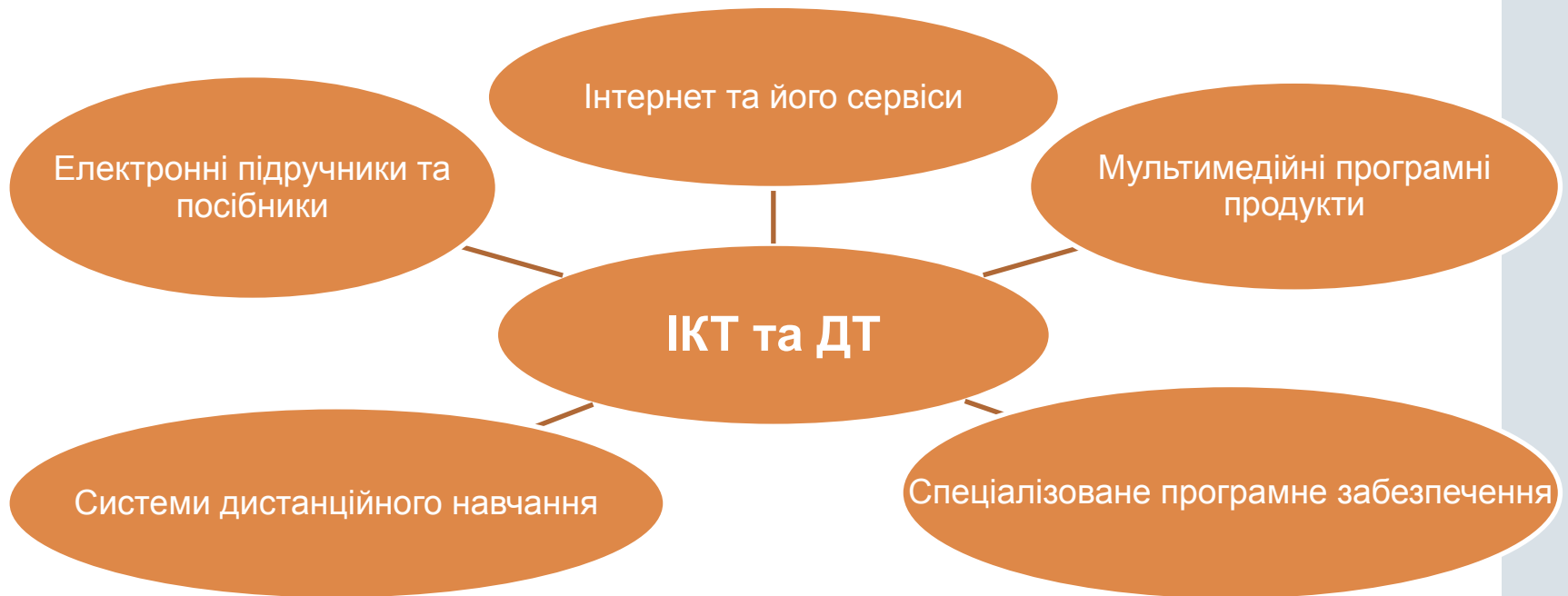
Рис. 1.2 Сучасні інформаційно-комунікаційні та дистанційні технології навчання

Номер ілюстрації, її назва і пояснювальні підписи розміщують послідовно під ілюстрацією.